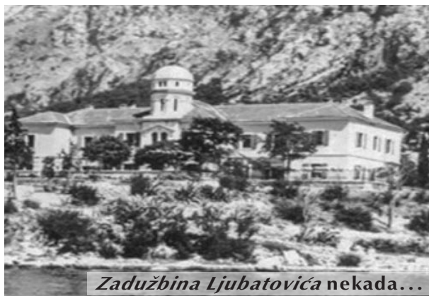
Zadužbina Ljubatovića nekada...

Zašto je toliko vremena trebalo da se ispuni Dimitrijevo zavijet nije poznato. Tragovi nerada, javašluka i mogućih kriminalnih radnji, izbrisani su.