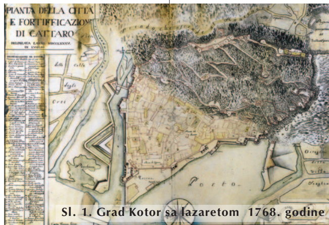
Sl. 1. Grad Kotor sa lazaretom 1768. godine