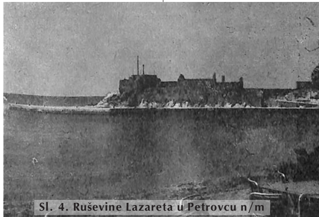
Sl. 4. Ruševine Lazareta u Petrovcu n/m

Petrovački lazaret sastojao se od 2 dijela. Veći dio – u površini oko 450 m 2 – se nalazio pri kopnu, ograđen sa jakim zidovima; dok je manji dio – u površini oko 110 m 2 – se nalazi na susjednom ostrvu, zapravo na uzdignutoj morskoj stijeni. Sa vrha ove stijene pruža se pogled na varošicu sa okolinom sve do Bara. 20)