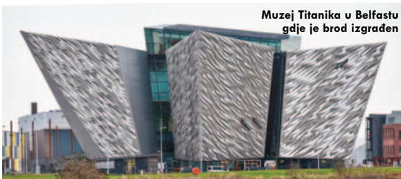
Muzej Titanika u Belfastu gdje je brod izgrađen

U svijetu postoje tri muzeja koja čuvaju sjećanje na tragediju Titanika . Jedan je Muzej Titanika u Belfastu, a druga dva se nalaze u američkim gradovima.