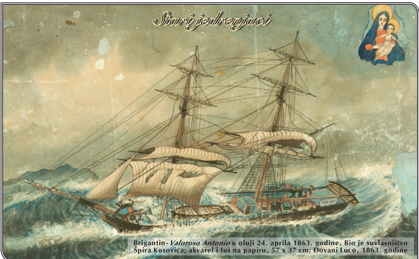
Brigantin- Valoroso Antonio u oluji 24. aprila 1863. godine. Bio je suvlasništvo Špira Kosovića; akvarel i tuš na papiru, 57 x 37 cm; Đovani Luco, 1863. godine