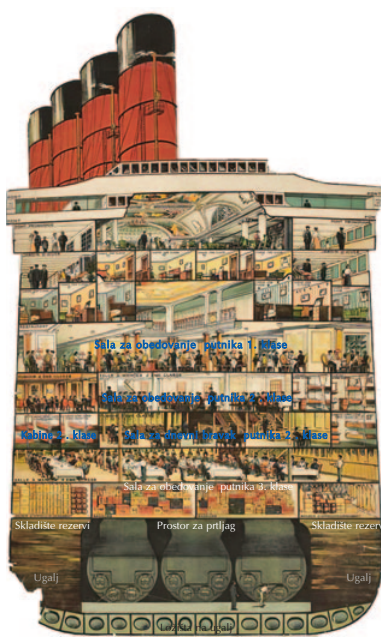
Presjek po širini pramčane strane Titanika na mjestu procjepa