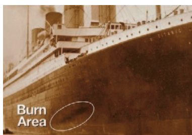
Fotografija sa sjenkom na trupu nastala od požara

Tehničke karakteristike najmoderniji brod svoga doba