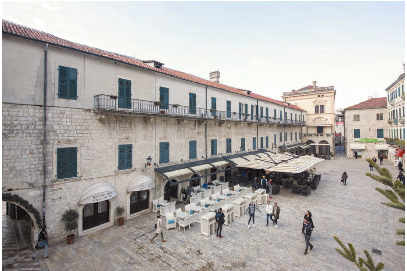
Slika 48. Današnji izgled Providurove palate