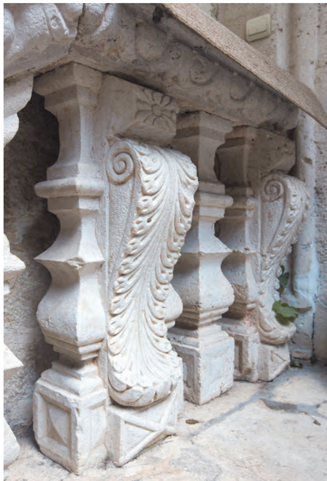
Slika 56. Detalj unutrašnjeg stepeništa

Zgrada je danas u privatnom vlasništvu i služi u stambene svrhe. Sa lijeve strane u prizemlju zgrade nalazi se Udruženje boraca NOR-a i antifašista Kotor.