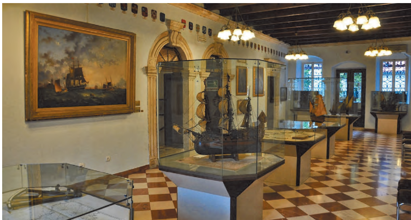
Slika 67. Centralna sala prvog sprata palate Grgurina

Pomorac, brodovlasnik, gotovo redovno plemić, kao preduslove gradnje svoje barokne palate htio je zadovoljiti najmanje četiri principa: udobnost – palata