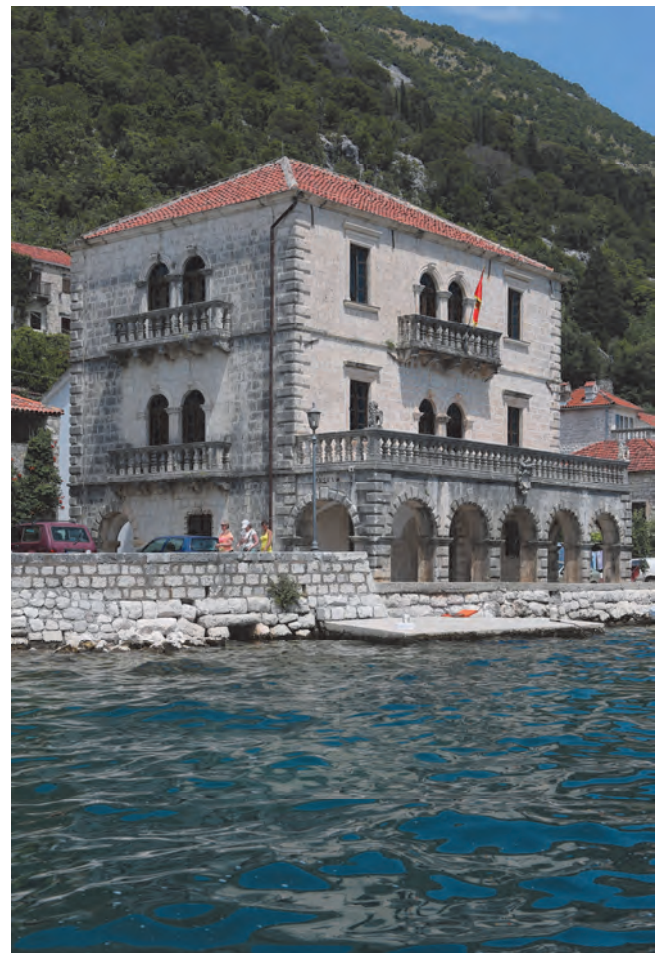
Slika 118. Palata Bujović, pogled s mora