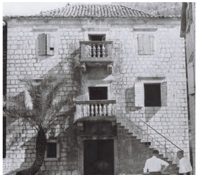
Slika 80. Palata Šestokrilović, stari izgled

Palata je renovirana, danas se koristi u stambene svrhe.