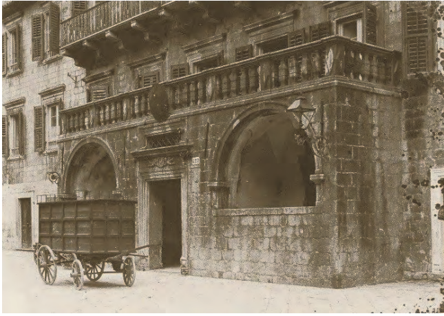
Slika 10. Nekadašnji izgled ulaza u palatu Pima

nauka. Najpoznatija ličnost porodice bio je prvi katorski pjesnik humanista Bernard Pima, poeta laureatus, ovjenčan lovorovim vijencem na rimskom Kapitolu, slavljen u svoje vrijeme, sudionik čitanja papske bule u Kotoru 1514. godine. Umro je veoma mlad 1518. godine i sahranjen je u Crkvi Sv. Marije od Rijeke, gdje mu se do 1930. godine nalazio epitaf na nadgrobnoj ploči, koji je kasnije prenesen na mermernu ploču. U najstarijim katorskim dokumentima pominju se 1326. godine Rusin Pima i njegovi sinovi Petar i Vita, a krajem vijeka, 1395, Grubojica Pima, kao vrlo ugledan građanin. Humanistički pjesnik Jeronim Pima ističe se početkom XVII vijeka, pišući na našem jeziku, a sredinom istog vijeka pominje se Ljudevit Pima, doktor prava, profesor i prorektor Padovanskog uni-