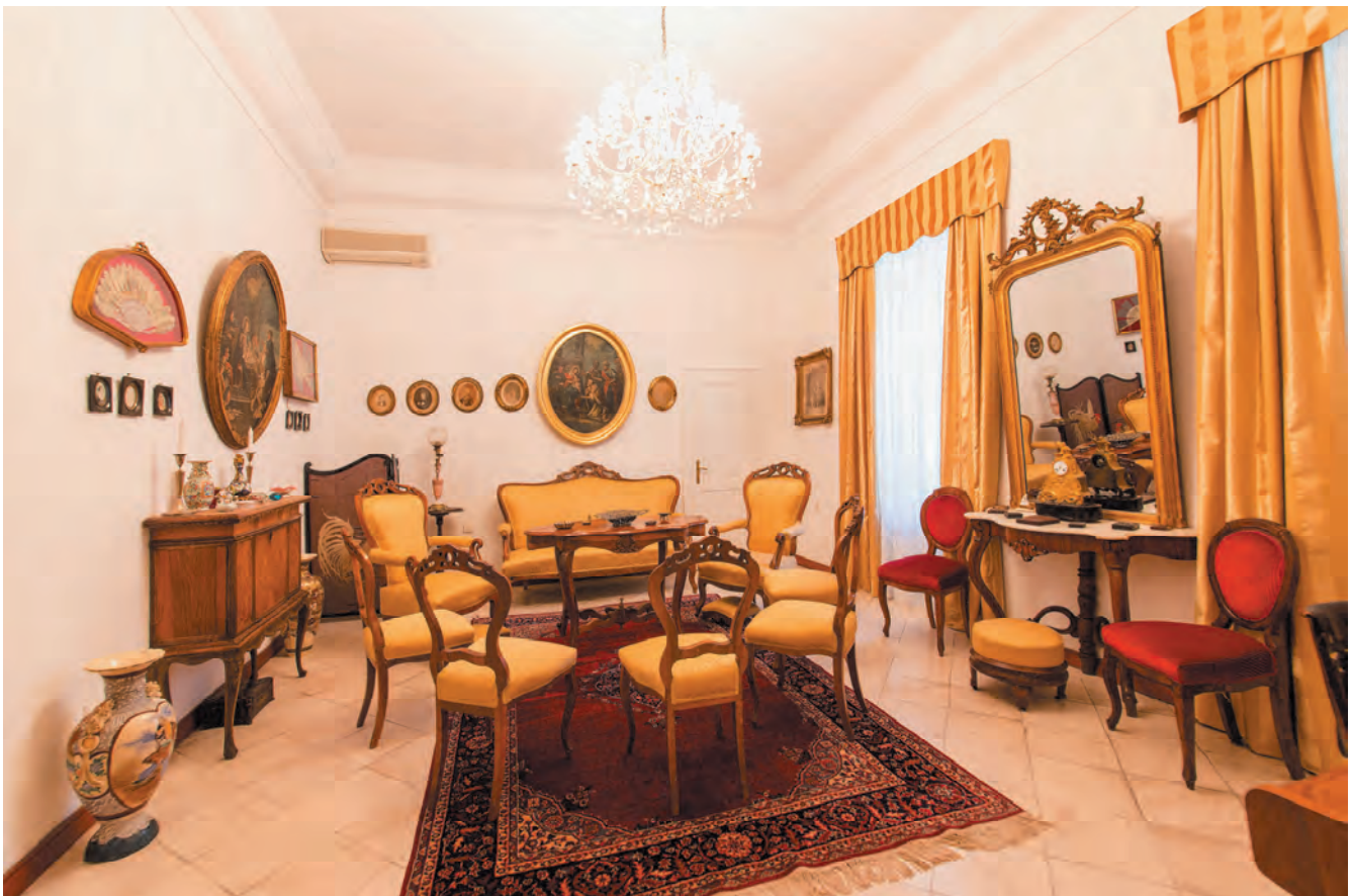
Slika 12. Žuti salon u palati Pima, danas vlasništvo porodice Lazarević

Poslije preseljenja Nautičke škole, palata je kasnije ponovo korišćena u stambene svrhe. Danas u cjelini pripada porodici Lazarević. Ukusno uređenu zgradu sadašnji vlasnici brižno održavaju, i ona je zadržala u osnovi izvornu namjenu stanovanja bez novokomponovanih prepravki. Porodica Lazarević je i u enterijeru zgrade, sa ukusno biranim namještajem, vrijednom zbirkom slika, portreta, ikona, zbirkom oružja i bogatom bibliotekom u potpunosti sačuvala raskoš i smisao za estetske vrijednosti, što je usklađeno sa nekadašnjim baroknim načinom življenja u ovoj palati.