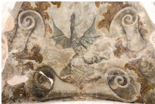
Slika 123. Zidno slikarstvo u kapeli Gospe od Rozarija, autora Tripa Kokolja