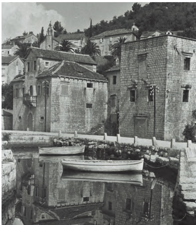
Slika 78. Pogled na palatu Bronza bočno, stara fotografija