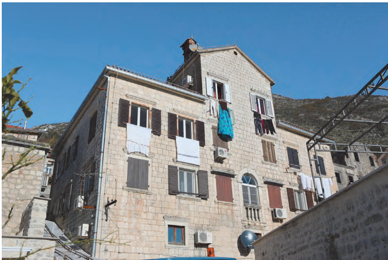
Slika 89. Današnji izgled palate Balović