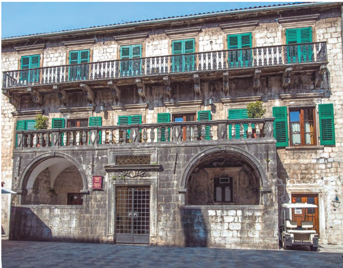
Slika 9. Današnji izgled palate Pima