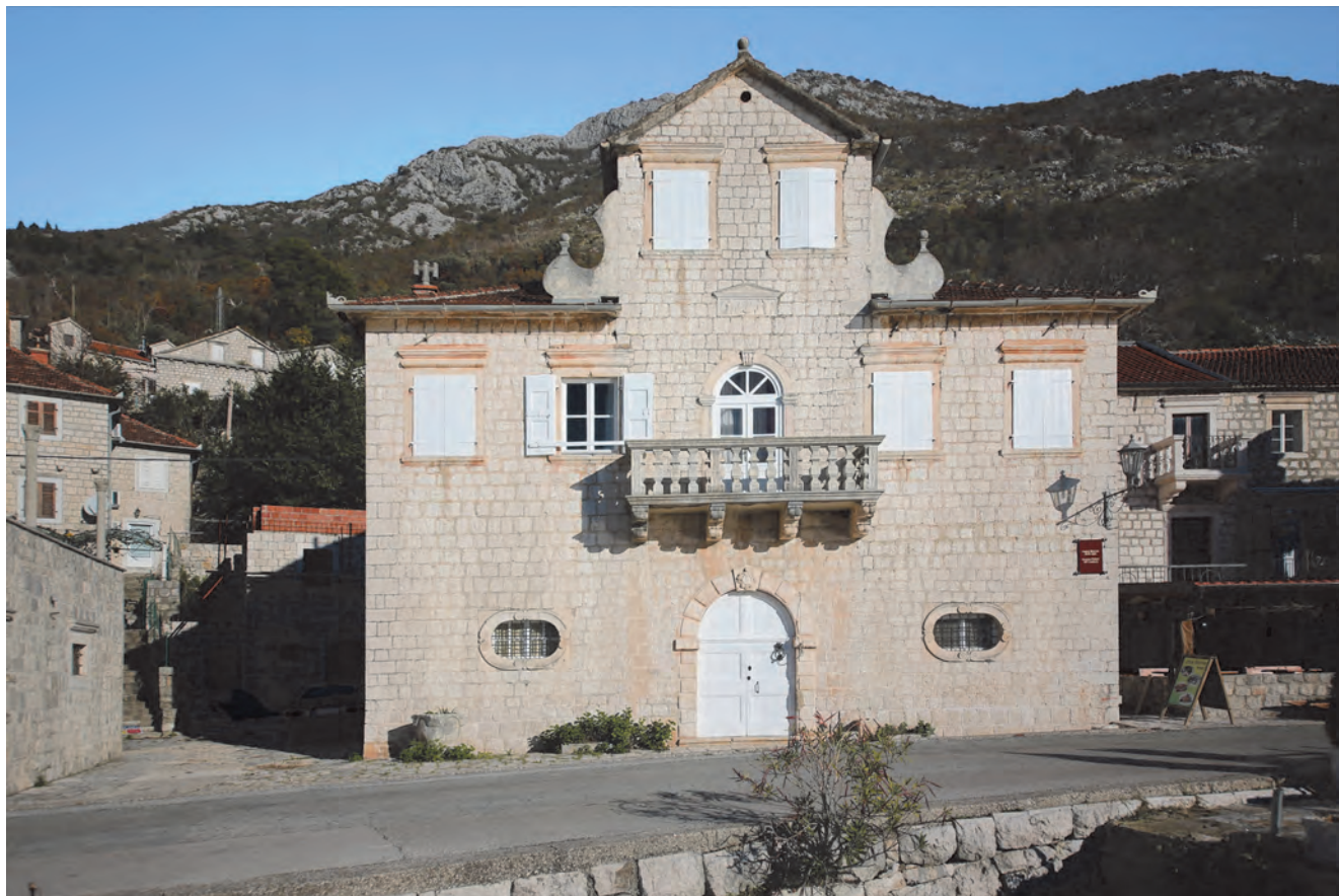
Slika 77. Palata Bronza, današnji izgled