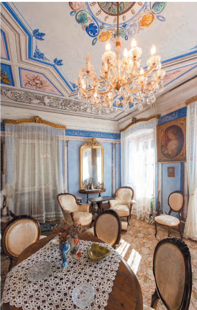
Slika 105. Detalj salona iz suprotnog ugla

Najznačajnija ličnost bratstva, kazade Martinović, bio je Marko Martinović (1663–1716), pomorski trgovac, pedagog i pisac. Njegov kršteni kum bio je nadbiskup Andrija Zmajević. Svoje osnovno pomorsko obrazovanje stekao je, poput brojnih Peraštana, u franjevačkom peraškom samostanu, a ovo teorijsko znanje kasnije je unapredio praksom na brodu. Vješt pomorac, plovio je prvobitno na brodu u svom vlasništvu, tipa fregadun, „Cavalier Vigilante“. Zahvaljujući izvrsnom pomorskom iskustvu i vještini u upravljanju brodom, mletački Senat izabrao ga je 1697. godine da sa pedagogima iz pomorskih nauka u Veneciji obučava ruske kneževe i boljare, njih 17. Kao pomorski pedagog ruskim pitoncima predavao je nautiku, kako se navodi u izvorima „o busoli, poznavanju vjetrova i čitanju navigacionih karata“. Sa svojim učenicima izveo je i tri praktična putovanja. Godine 1698. s njima se zaustavio u Perastu, gdje je obavljen dio dopunske nastave. Njegova nautička škola, popularno Nautika, nalazila se na sjevernom kraju Perasta, blizu palate Bujović. U Muzeju grada Perasta nalazi se velika slika, rađena u ulju na platnu, na kojoj je prikazan Marko Martinović kako podučava ruske boljare. Marko Martinović predstavljen je sa busolom i kartom vjetrova, okružen pitoncima koji budno prate predavanje. U gornjoj polovini slike, iznad ruskog carskog orla, ispisana su imena ruskih pitomaca i titule Petra Velikog. Kopija ove slike nalazi se u Pomorskom muzeju Crne Gore u Kotoru.