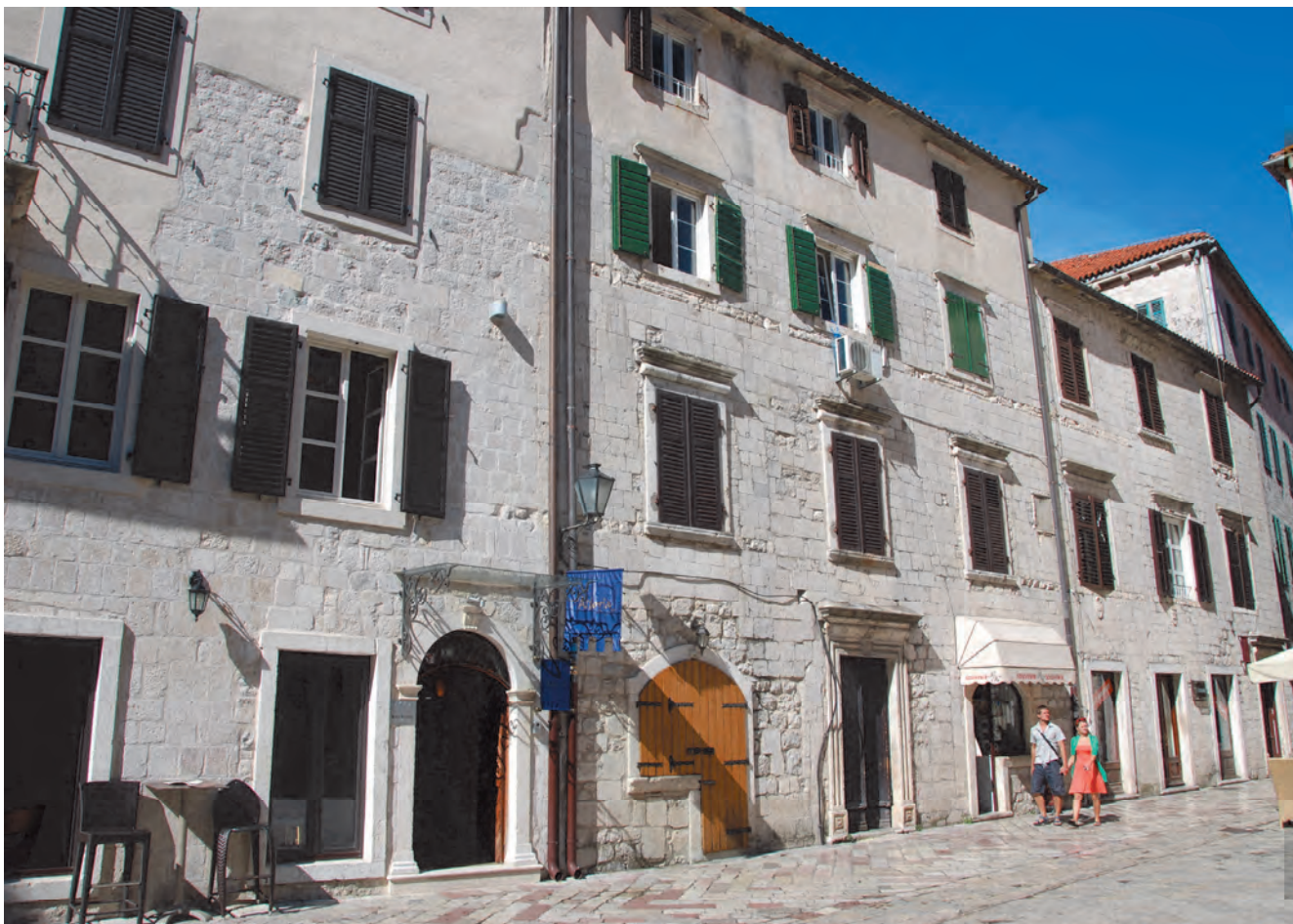
Slika 2. Današnji izgled palate Buća