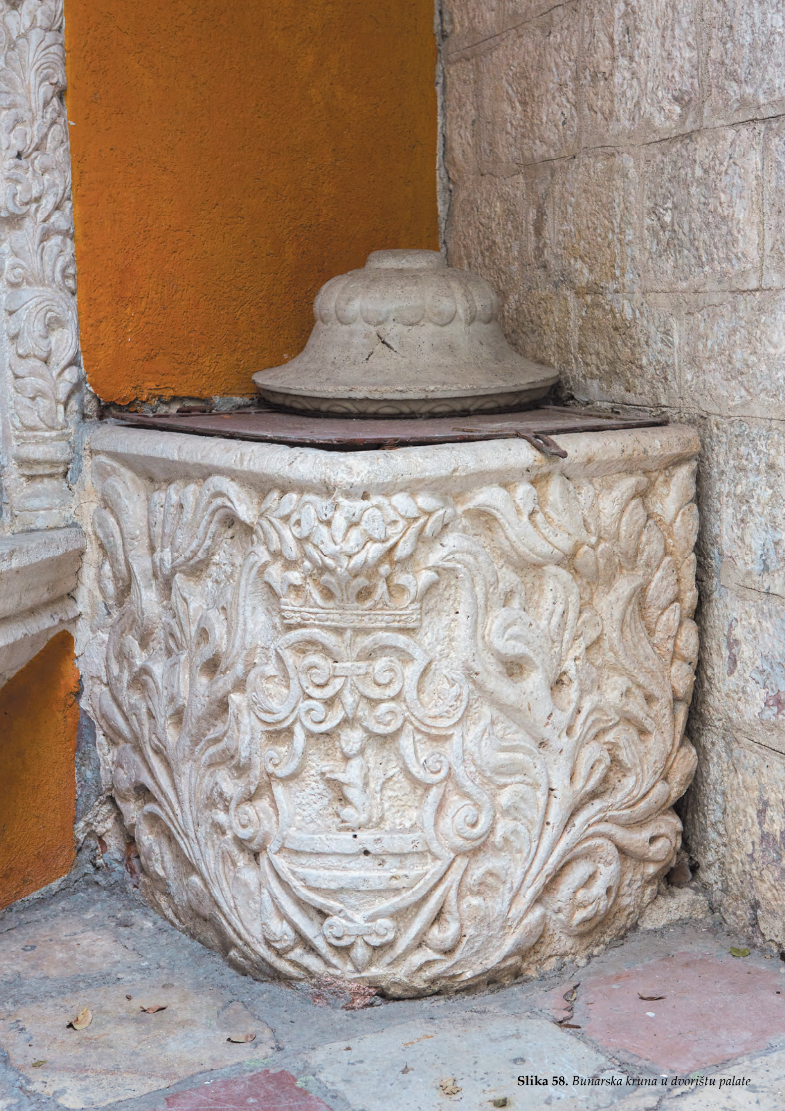
Slika 58. Bunarska kruna u dvorištu palate