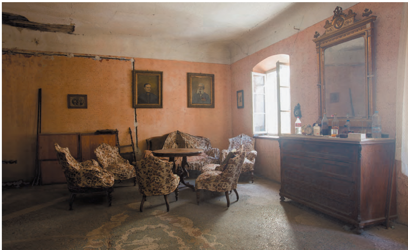
Slika 39. Centralni salon okrenut ka istoku

od rijetkih kotorskih palata sa vrtom i zasađenim rastinjem. U vrtu raste stablo feđoje ( Feijoa sellowiana ), zimzelene biljke iz porodice mirta, visoke do 5 m, predivnog cvijeta koji cvjeta u proljeće i plodova koji dozrijevaju u oktobru. Porijeklom iz Južne Amerike, ovu rijetku vrstu voćke na našim prostorima donijeli su bokeljski pomorci.