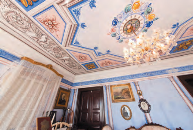
Slika 103. Dio salona sa pogledom na plafon