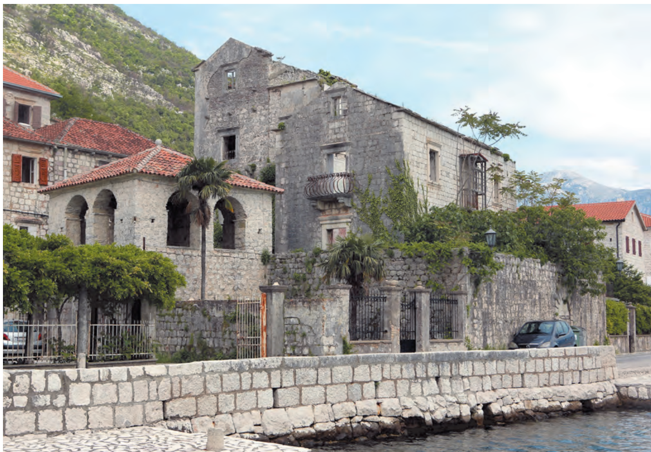
Slika 94. Današnji izgled palate Visković