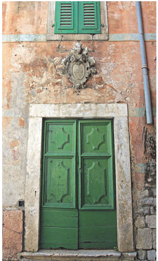
Slika 35. Današnji izgled glavnog portala palate Vrakjen

Kroz ovaj portal ulazi se u omanji salon, koji je centralna omanja prostorija u ravni sa prozorom iznad glavnog portala. Desno od ove prostorije ulazi se u oveci glavni salon. Salon se prostire dužinom u pravcu istočnih prozora, a kraćim stranama u smjeru sjever-jug. Iz omanjeg pomenutog ulaznog salona ulazi se u manju prostoriju, u kojoj se takođe nalazi pod u teraco tehnici. Sjeverno od nje je mala kućna kapela, koja je u obliku omanjeg hodnika i pokriva lučni prolaz, vidljiv sa ulice, koji razdvaja sjevernu fasadu na dva dijela. Na podu je izvanredno očuvan mozaički ukras, kantaros, ranohrišćanski simbol izvora života, fons vitae , postavljen u pravcu sjever-jug.