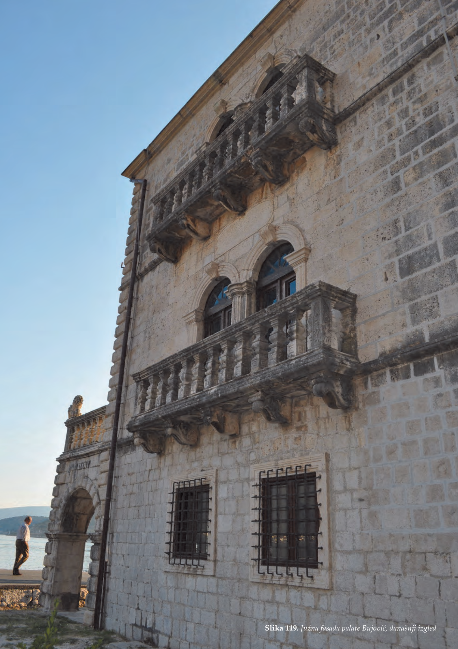
Slika 119. Južna fasada palate Bujović, današnji izgled