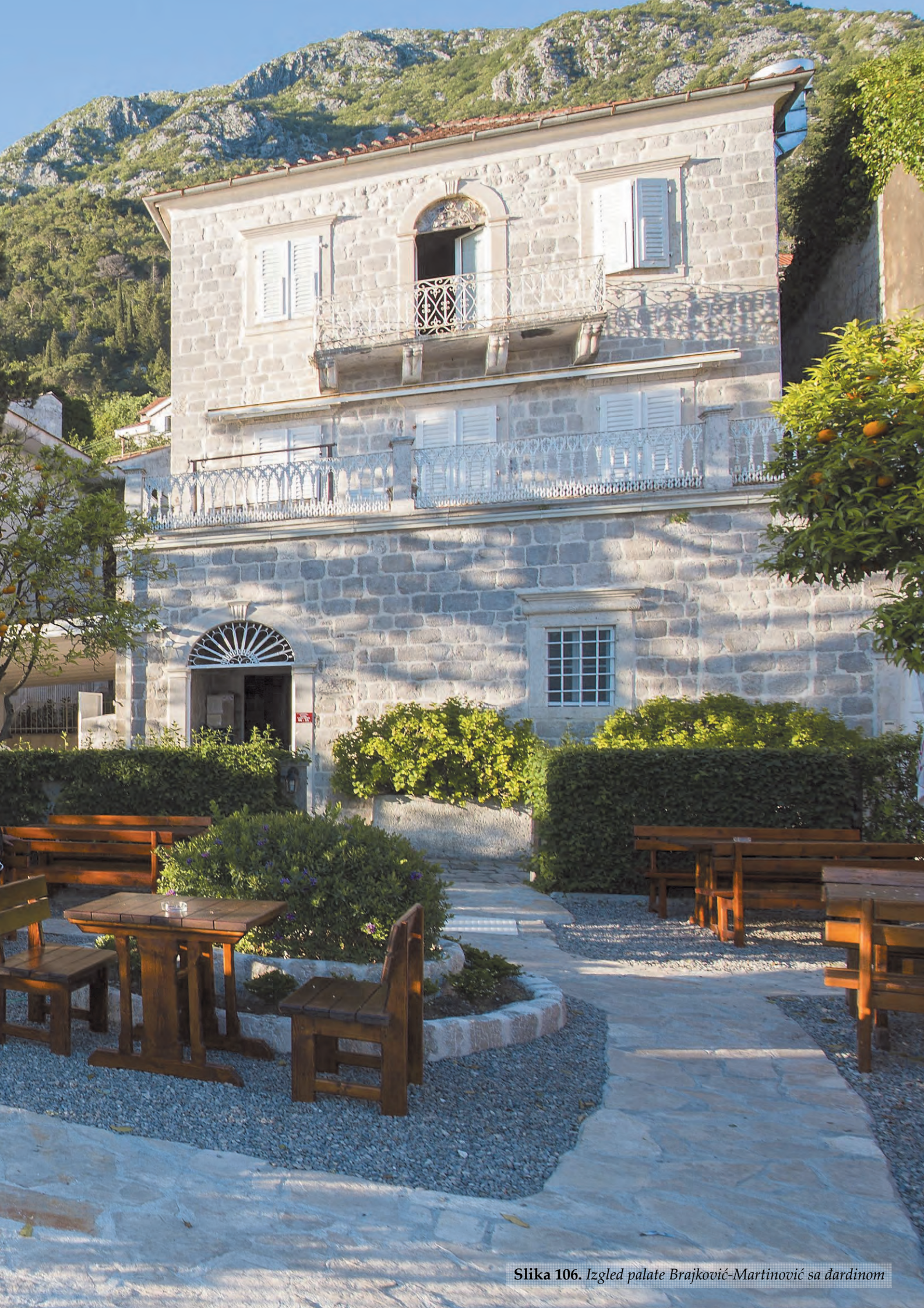
Slika 106. Izgled palate Brajković-Martinović sa đardinom