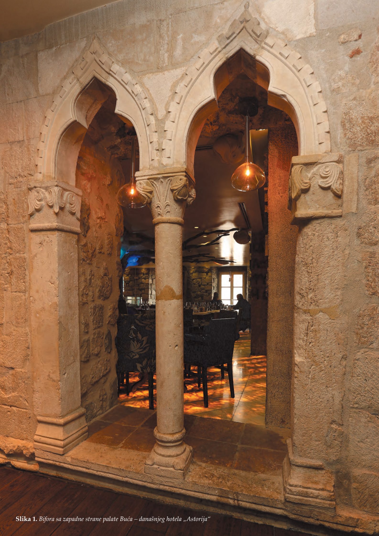
Slika 1. Bifora sa zapadne strane palate Buća – današnjeg hotela „Astorijsa“