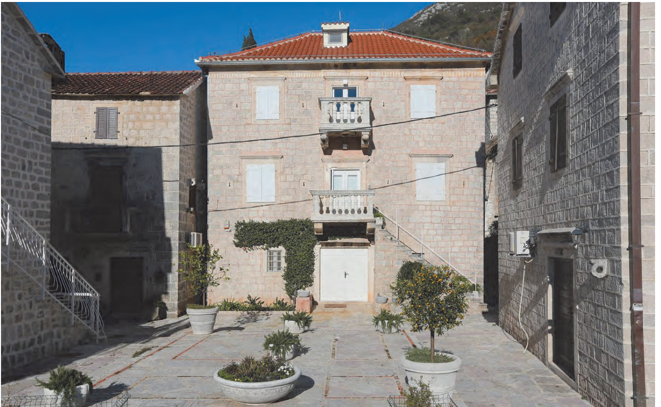
Slika 79. Palata Šestokrilović, pročelje sa dvorištem