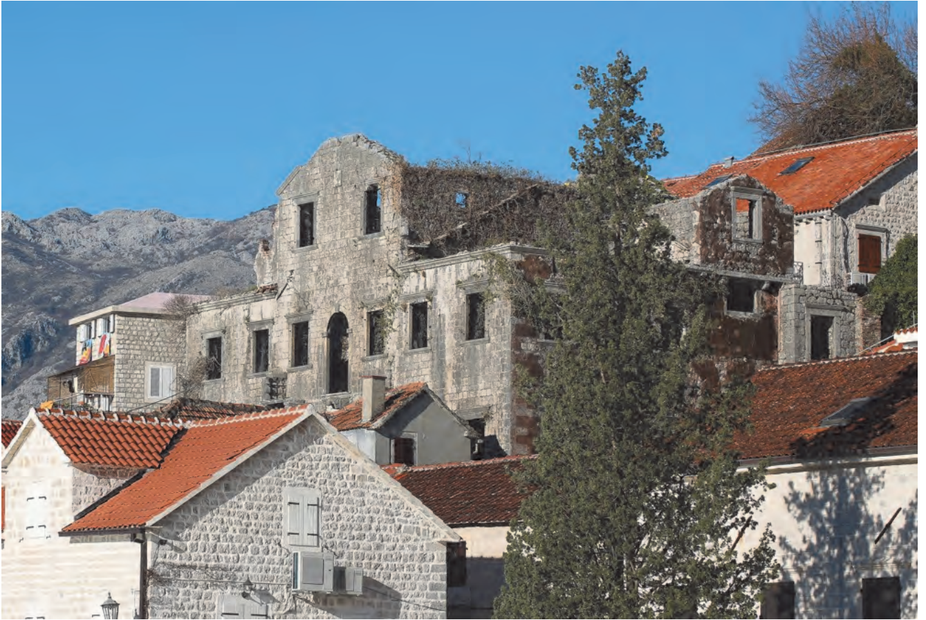
Slika 83. Današnji izgled palate Mazarović