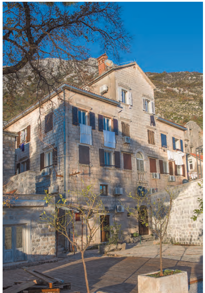
Slika 93. Pogled na palatu iz dvorišta

Ova palata je restaurisana 1981. godine za potrebe samačkog hotela. Do tog datuma u palati je bio sačuvan originalan raspored prostorija. Danas je stambena zgrada.