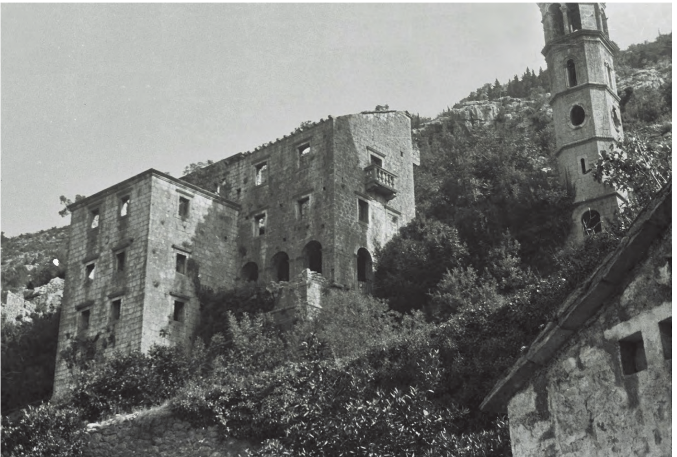
Slika 121. Kompleks palata Zmajević sa zvonikom, stara fotografija

Palata je izgrađena na krševitom usponu, od lokalnog kamena, tako da se čini da je srasla sa okolnim