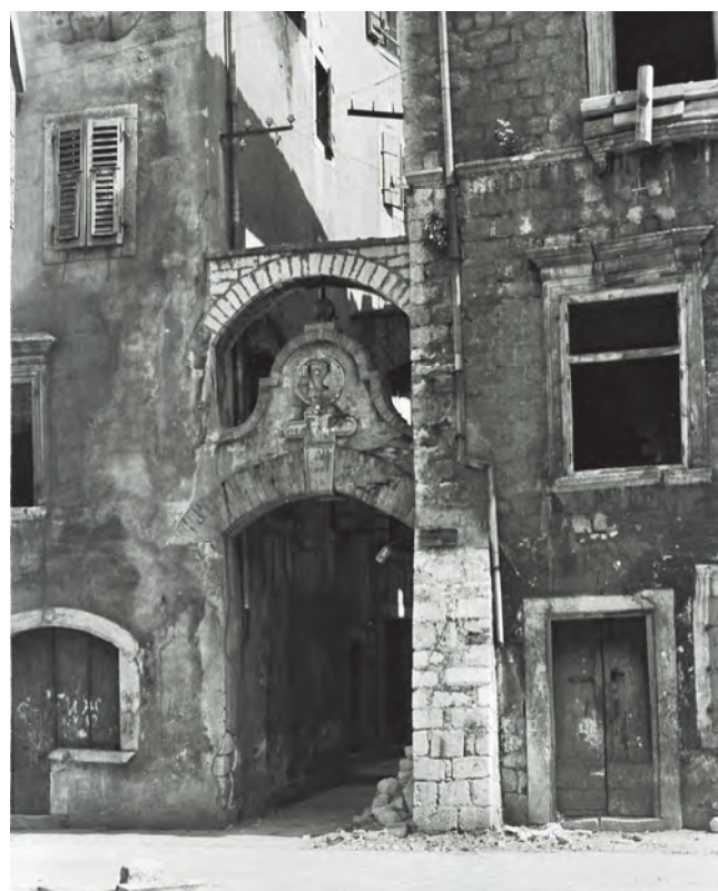
Slika 60. Nekadašnji izgled palate Grubonja

kornjačom, sponom između neba i zemlje, kao i vodenim gušterom, čiji je preobražaj povezan sa Hristovim vaskrsenjem. Natpis na mermernoj ploči, koja je postavljena ispod grba, sadrži pomen prve kotorske