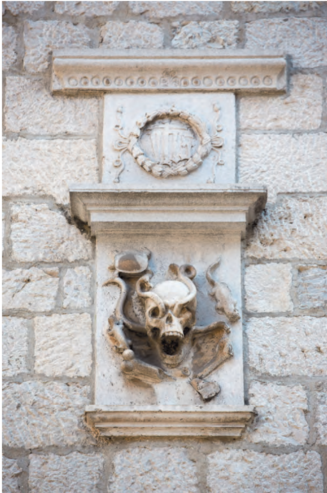
Slika 61. Memento mori sa hristogramom iznad njega