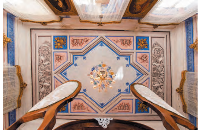
Slika 104. Oslikani plafon salona