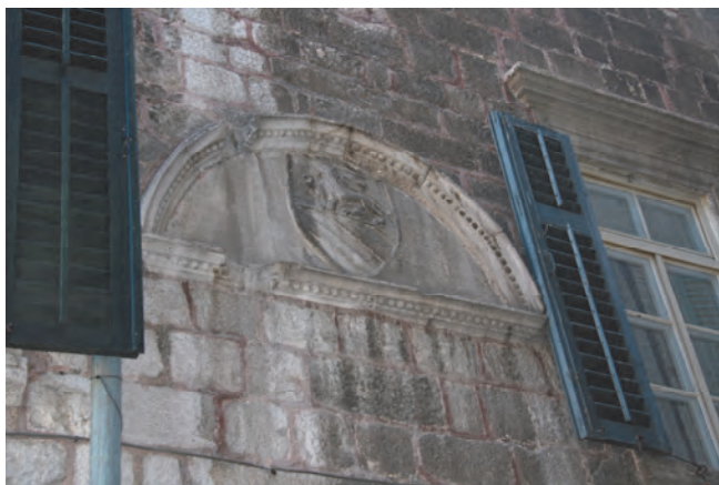
Slika 19. Grb porodice Bizanti u granuliranoj luneti