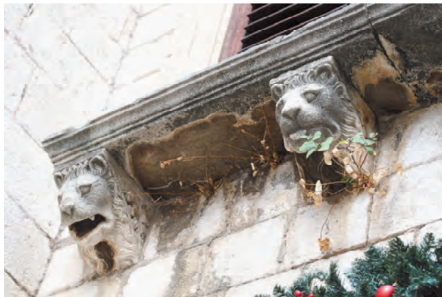
Slika 43. Lavlje glave u funkciji konzola

Sjeverozapadni zid palate okrenut dvorištu posjeduje nepravilno raspoređene otvore, a dvorište je nastalo nasipanjem zemlje na temelje porušene palate porodice Verona, koja je ovdje postojala do početka XX vijeka. U prizemlju su dva otvora, prozora, a posljednji, okrenut prema trgu, služio je kao magazinski prozor. Na prvom spratu je centralni otvor, koji je duži, i u ravni sa prizemnim, centralnim prozorom. Na samom kraju, u pravcu dvorišta, linearno profilisan portal, poput profilacije svih otvora na ovom krilu palate, sa dijamantskim vrhovima na bazi. On je danas u funkciji prozora. Iznad njega je gotovo istovjetan portal sa minijaturalnim baroknim balkonom sa profilisanom pločom, koja se oslanja na lisnate konzole, a oko je novija željezna ograda. Ovo krilo palate podsjeća na renesansu, iako je rađeno u baroknom razdoblju, na samom kraju XVII vijeka. Na osnovu podataka iz Prve knjige kotorskih notara, koja obuhvata period od 1326. do 1337. godine da je Jelena Drago, kćerka jednog od najmoćnijih kotorskih privrednika ser Medoša Tomina Draga, poklonila testamentom kotorskom biskupu Rajmundu porodičnu zgradu neposredno uz katedralu Sv. Tripuna. O postojanju jedne ovakve građevine svjedoče ostaci bifora i monofora u zidovima današnje biskupske palate. Sadašnja palata Drago očigledno nije ta ista građevina, već još jedna palata u vlasništvu porodice, jer se u istom testamentu pominje i zgrada na trgu,