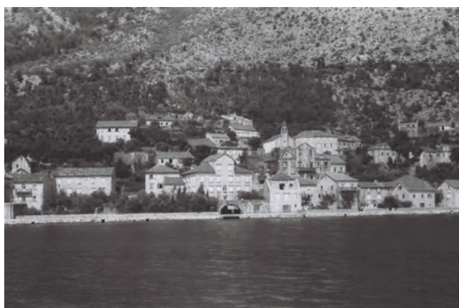
Slika 90. Palata Balović, pogled s mora, stara fotografija

U njoj se nalazila bogata zaostavština porodice, arhiv i biblioteka, nažalost odneseni iz Perasta 1933. godine, kao i poslije Drugog svjetskog rata. U ovoj palati gostovao je crnogorski vladika i pjesnik Petar II Petrović Njegoš 1846. godine i napisao pjesmu „Paris i