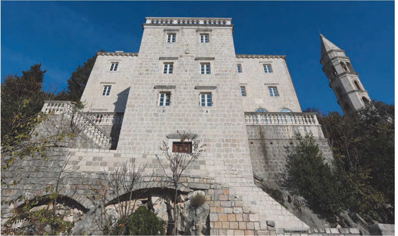
Slika 120. Današnji izgled kompleksa palate Zmajević sa zvonikom