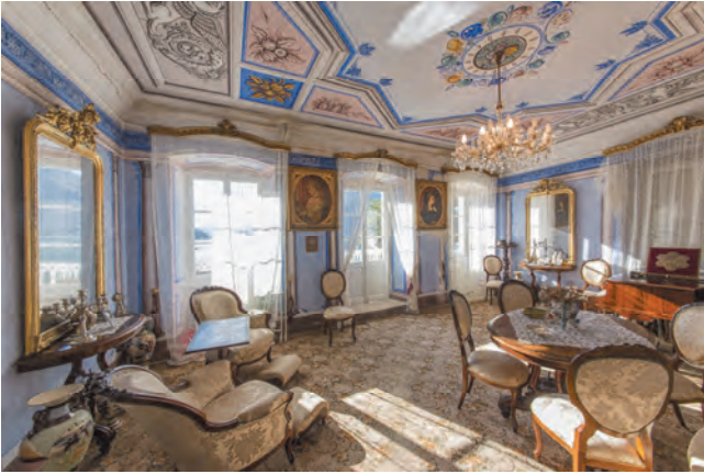
Slika 101. Salon porodice Brajković, okrenut prema moru