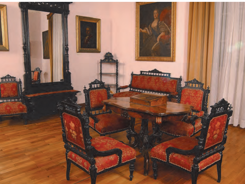
Slika 68. Sadašnja muzejska postavka, salon porodice Ivelić iz Risna

Enterijer palate Grgurina opravdava sva četiri opisana principa gradnje barokne palate i ponavlja, uz