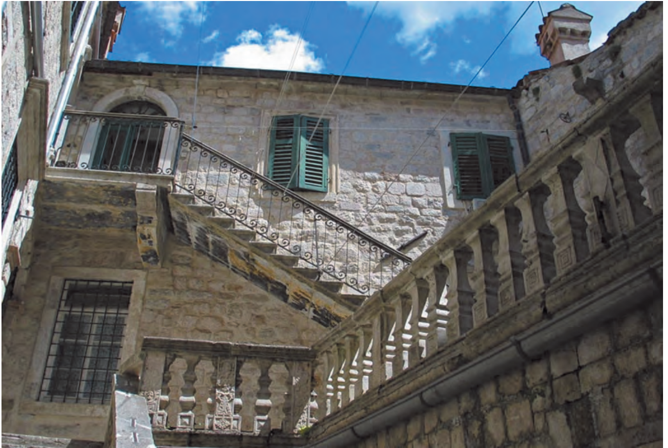
Slika 24. Detalj željezne ograde