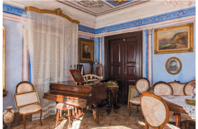
Slika 102. Dio salona porodice Brajković