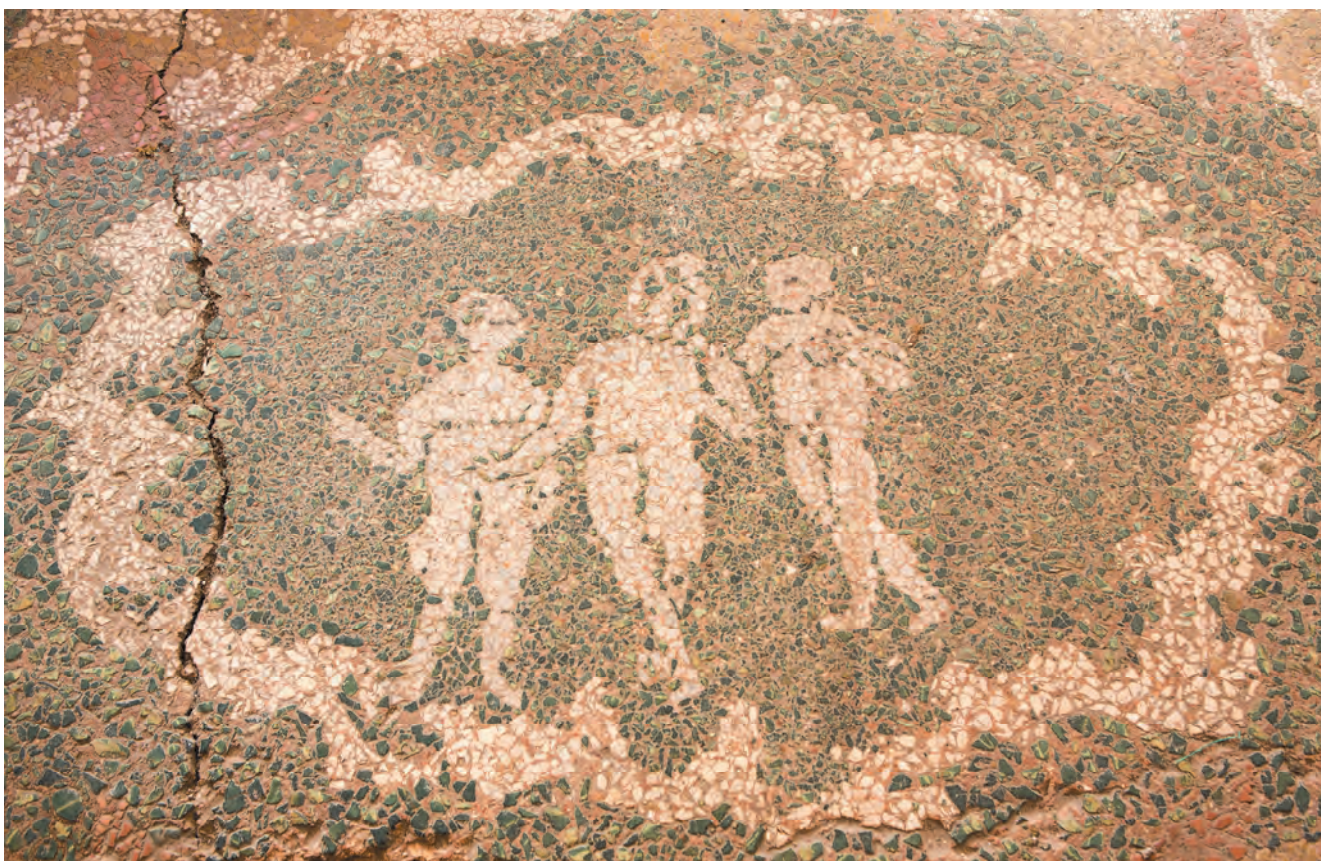
Slika 38. Tri gracije, teraco dekoracija na podu salona