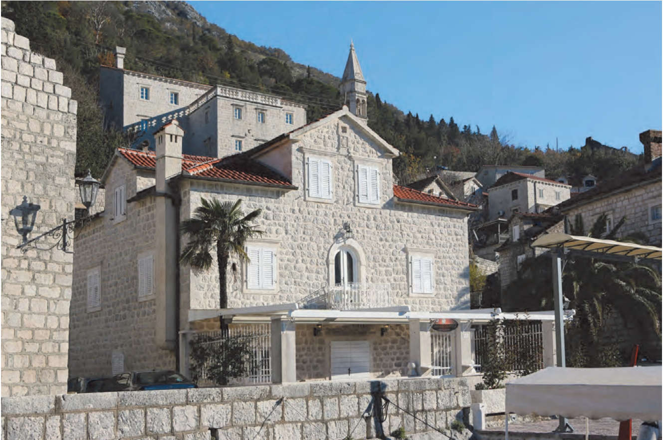
Slika 111. Današnji izgled palate Lučić-Kolović-Matikola