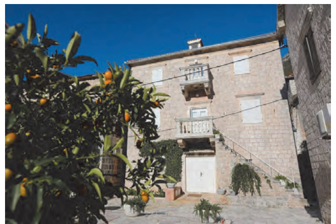
Slika 81. Detalj sa stablom agruma u dvorištu palate