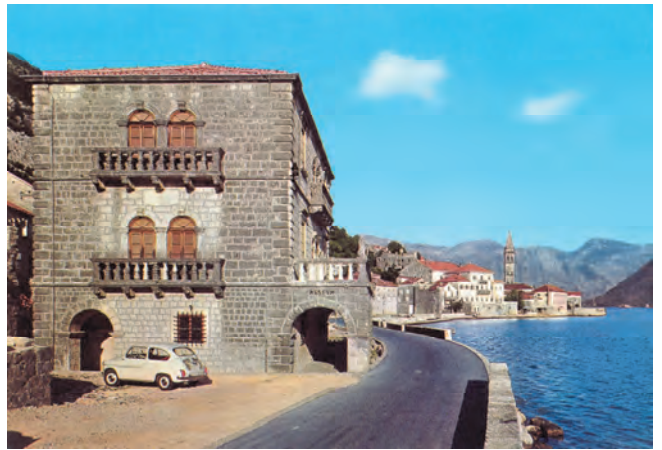
Slika 116. Sjeverna fasada palate Bujović, nekadašnji izgled