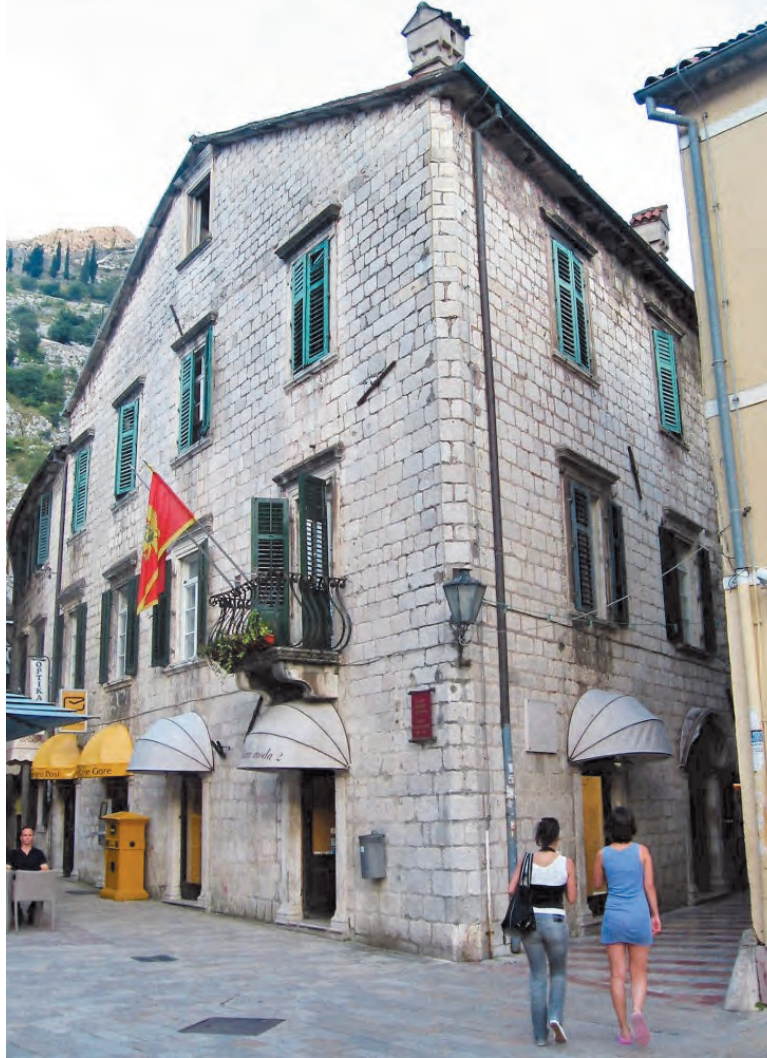
Slika 18. Izgled palate Bizanti sa sjeverozapadne strane

U isto vrijeme barokizirana je i unutrašnjost palate. Rekonstrukcija izvornog enterijera, koji je zatečen prilikom revitalizacije zgrade od posljedica katastrofalnog zemljotresa, 1674. godine, u to vrijeme uslovala je smanjivanje izvornih prostorija. Rekonstruisana izvorna tavanica u zapadnoj sobi prvog sprata posjeduje raskošno rezbaren drveni plafon, jedini do danas sačuvan u Kotoru. Pokrivao je, od postanka ovog originalnog dijela palate, niz kamenih konzola međuspratne tavanice i primarne „bankine“, grede nosače, na njima i do polovine njihovog raspona. Dva sačuvana polja tavanice, smanjena za dva ista polja tokom pomenute restauracije 1674. godine, ukrašena su profilisanim grednim vijencem od dasaka, sa pojasom