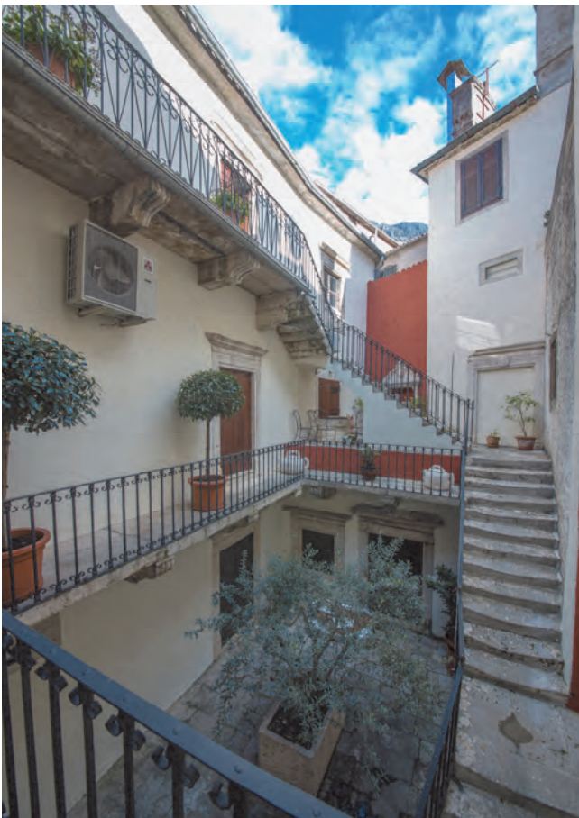
Slika 14. Današnji izgled dvorišta palate Pima