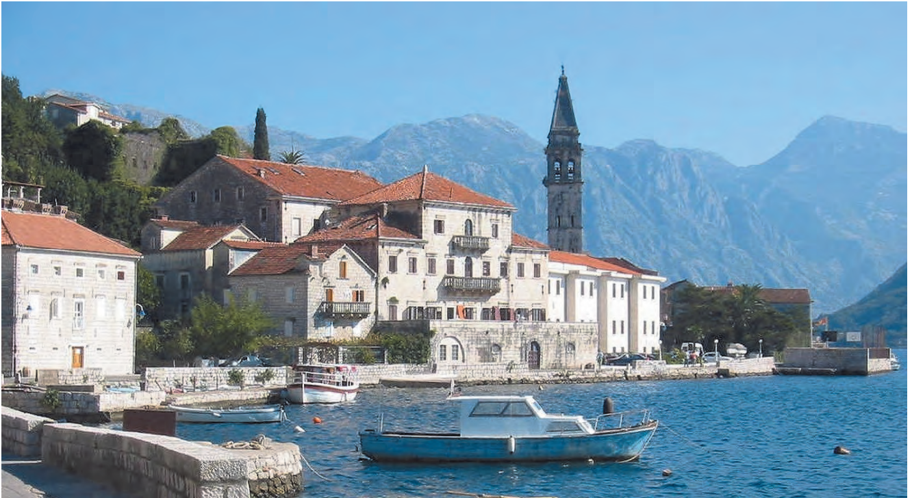
Slika 107. Palata Smekja danas, pogled sa sjeverozapada