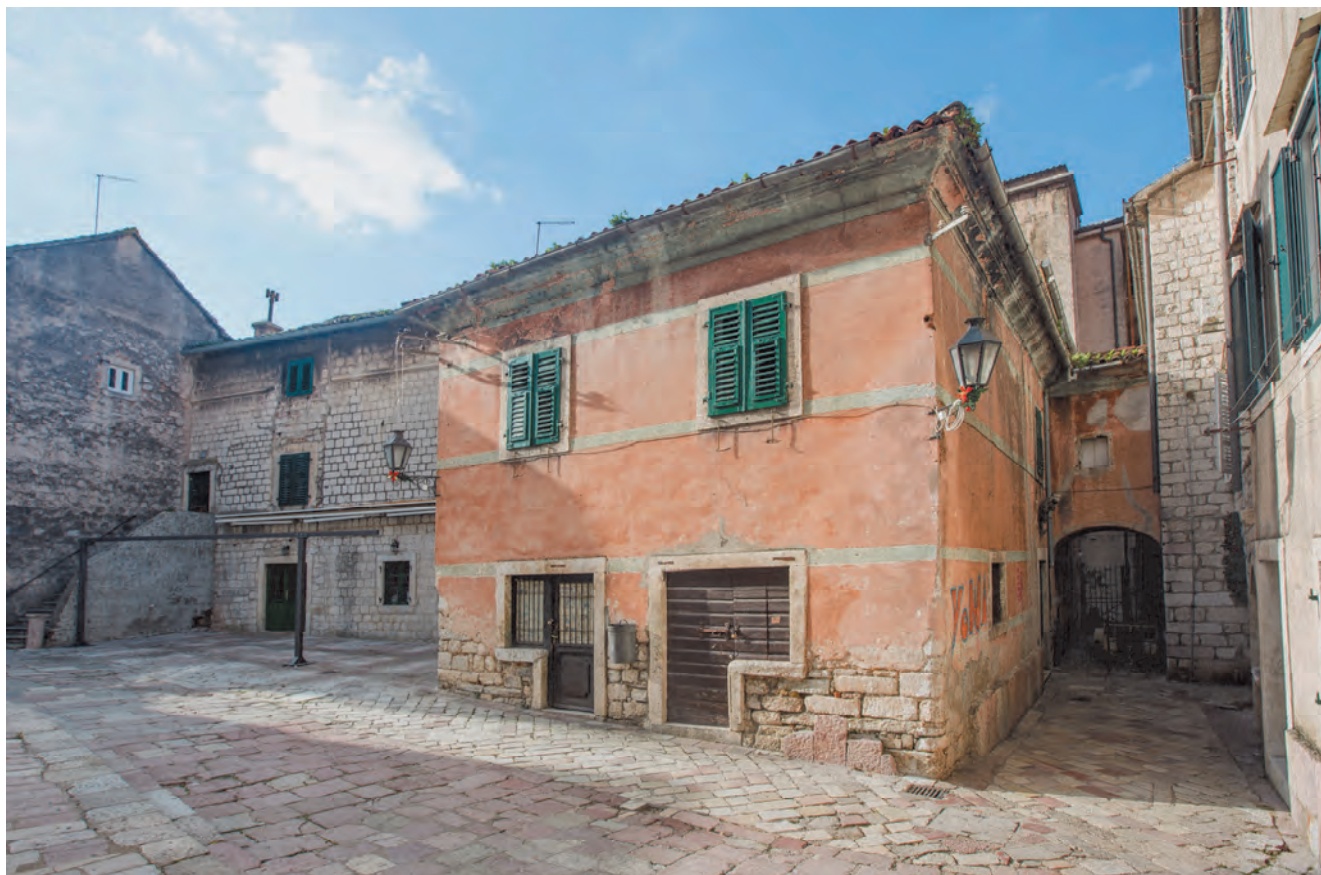
Slika 32. Današnji izgled palate Vrakjen