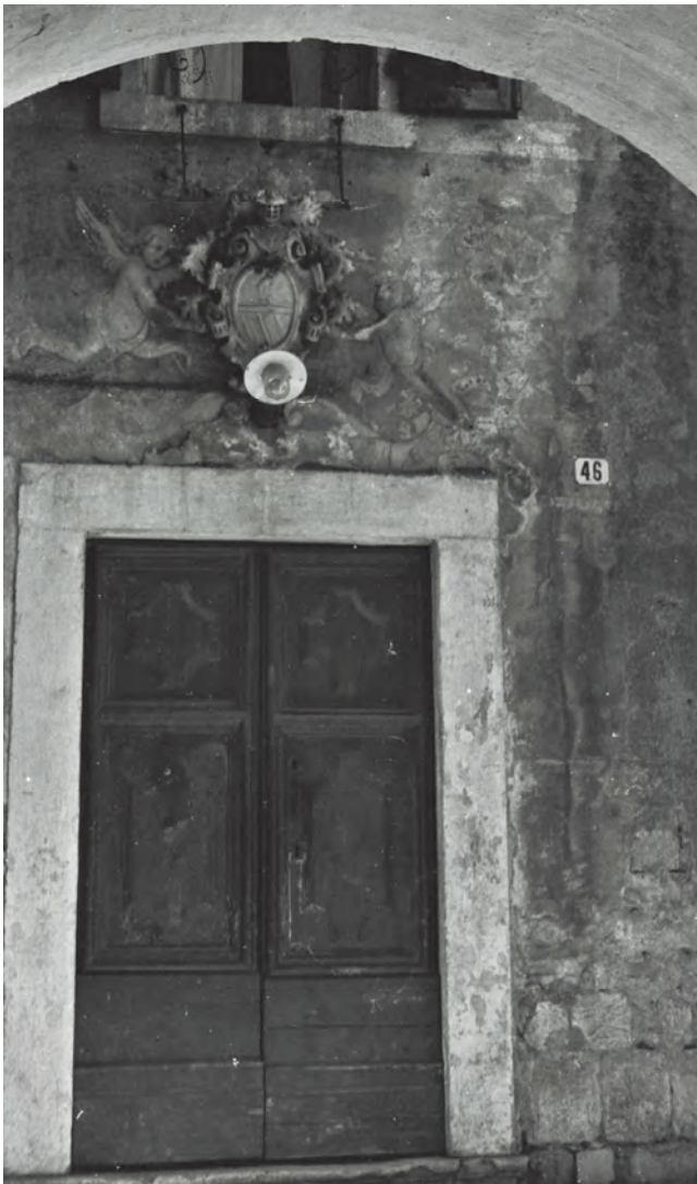
Slika 34. Nekadašnji izgled glavnog portala palate Vrakjen

kotorske arhitekture. Četvorougao prostrano prizemlje sa dvije očuvane kamene klupe, lijevo i desno od centralnog ulaza, vodi do tri lučna otvora. Centralni lučni otvor sa sačuvanom originalnom rešetkom ispod luka vodio je u dva zasvođena magazina, koja su služila za zatvaranje sitnih prestupnika. Dva lučna otvora sa strana vode do lijevog i desnog luka stepeništa, koji se sastaju na međuspratu sa teraco podom, od koga stameno kameno stepenište sa originalnim ukrasnim željeznim rukohvatima vodi do kamenog baroknog portala, kasnije obojeno tamnosmeđom bojom.