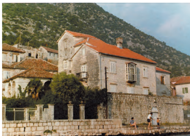
Slika 95. Izgled palate Visković oko 1979. godine

Porodica Visković, jedna je od najuglednijih peraskih porodica pripadala je Kazadi Dentali. Mnogi njeni članovi dali su ogroman doprinos političkoj,