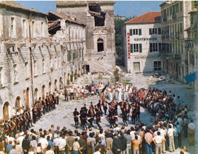
Slika 52. Kolo Bokeljske mornarice ispred Providurove palate, razrušene u zemljotresu iz 1979. godine