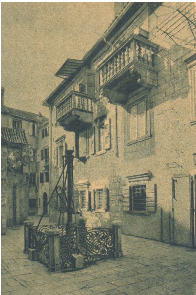
Slika 75. Nekadašnji izgled jugozapadne strane palate Lombardić, sa pogledom na česmu „Karampana“

Zgrada se pripisuje porodici Lombardić, čiji su vlasnici, kao ugledni trgovci, posjedovali palatu već u prvoj polovini XIX vijeka, tako da se prema datumu vlasništva i gradnje palate pretpostavlja da je zgrada izvorno bila u vlasništvu neke druge porodice, nama nepoznate, na što ukazuje popis stanovništva grada Kotora iz 1784. u kome se ne pominju Lombardići kao porodica naseljena u Kotoru.