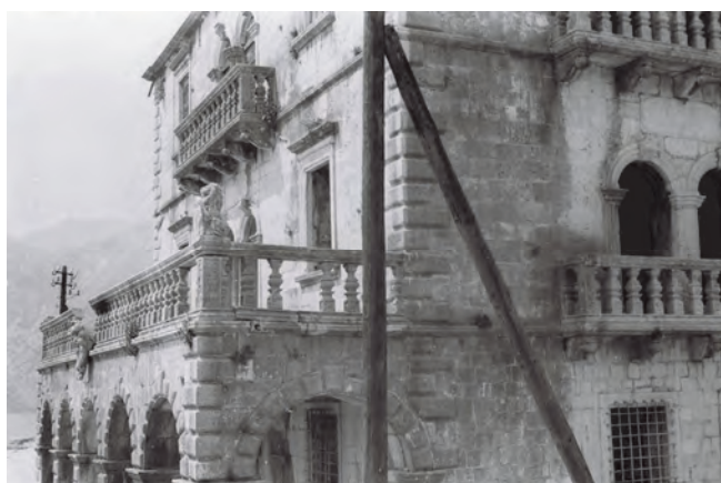
Slika 115. Nekadašnji izgled palate Bujović, sa izlazom na more