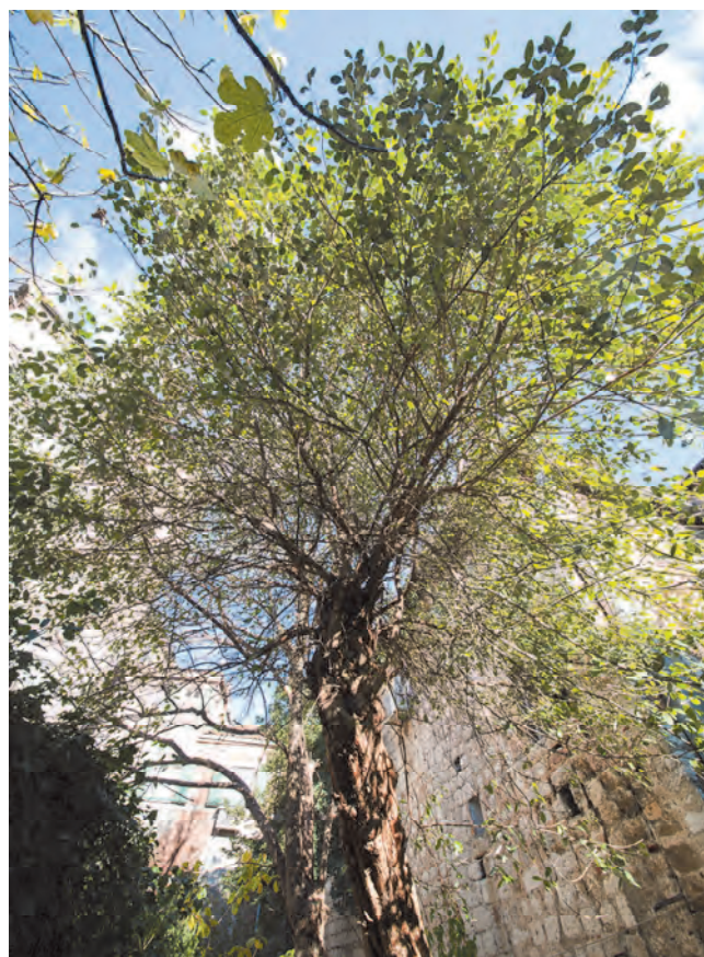
Slika 40. Feijoa sellowiana , zimzelena voćka u vrtu palate

Vrakjen stanovala u svojoj kući, koju je jednom prilikom založila za 500 perpera, blizu malih vrata za bacanje smeća, „portele“, neposredno uz mletačku bolnicu Sv. Đorđa. Poznato je i to da se žene nisu izlagale javnosti, već da je plemkinju Katenu dobošar ispod prozora oglašavao o sudskom procesu u vezi sa kućom.