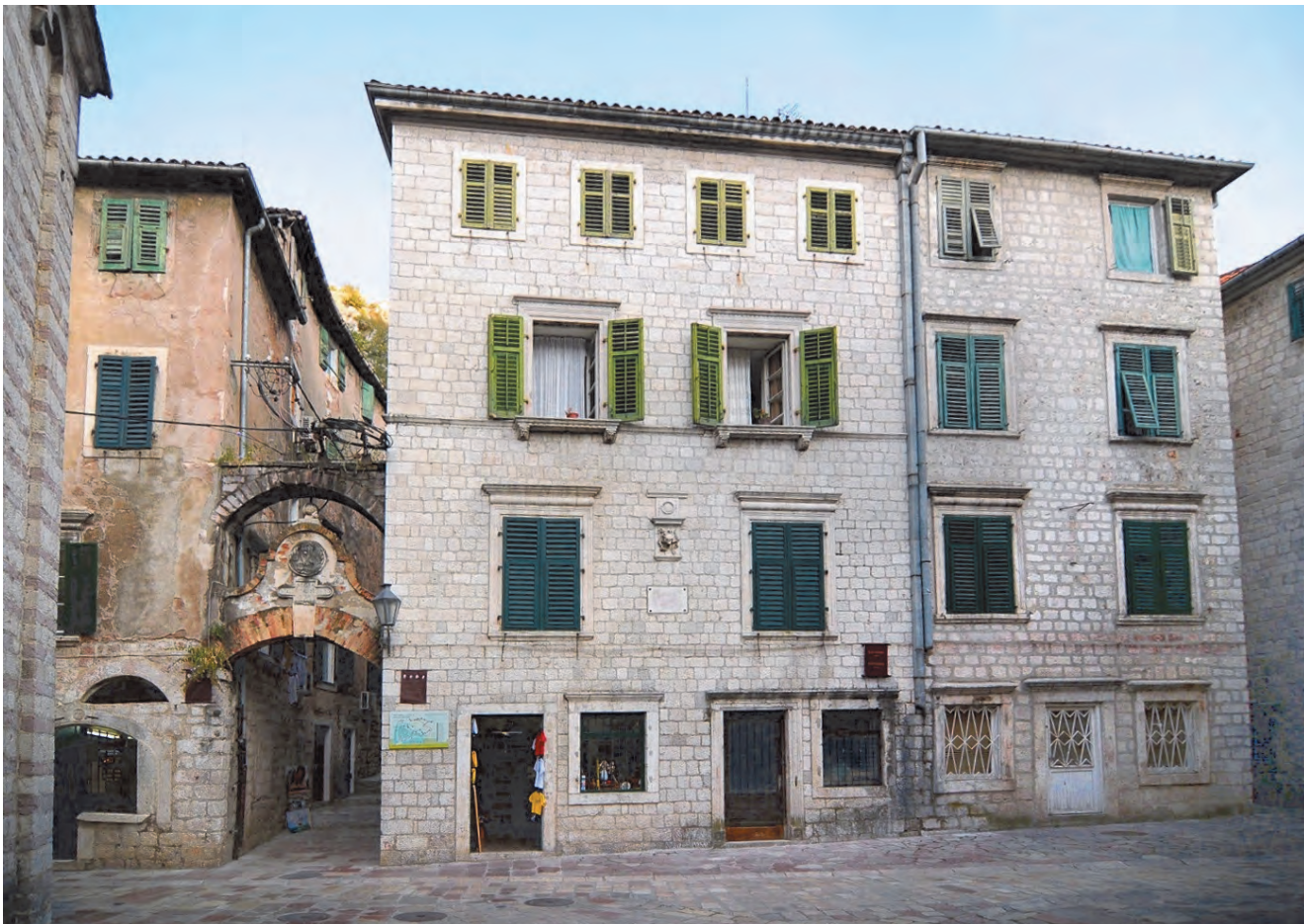
Slika 59. Današnji izgled palate Grubonja