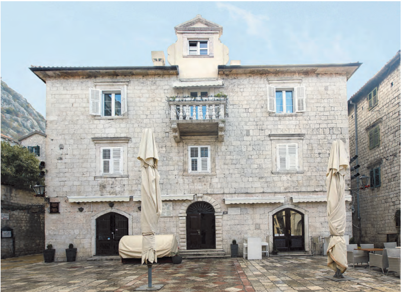
Slika 71. Sjeverna fasada palate Lombardić, sadašnji izgled