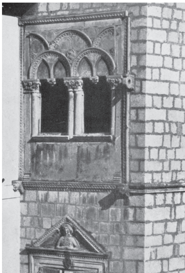
Slika 42. Nekadašnji izgled bifore na južnoj fasadi, oko 1900.

sanim kapitelom, granulirani ukrasi po rubovima, kao i oni u urednoj geometrijskoj formi sa motivom zmaja, grba porodice na sastavu i dva četvorolisna otvora zadivljuju svakim detaljem i čine raskošnu cjelinu. Na