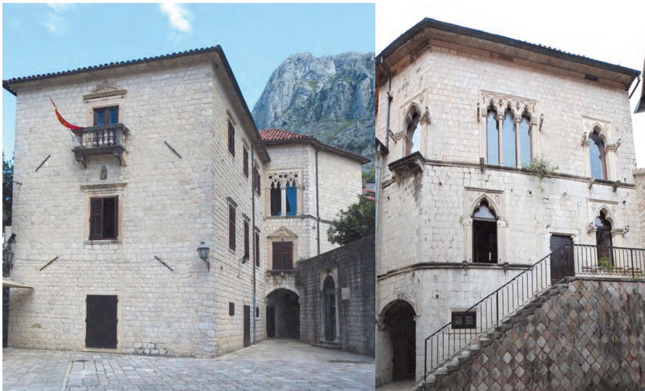
Slika 41. Palata Drago – današnji izgled južne i sjeverne fasade