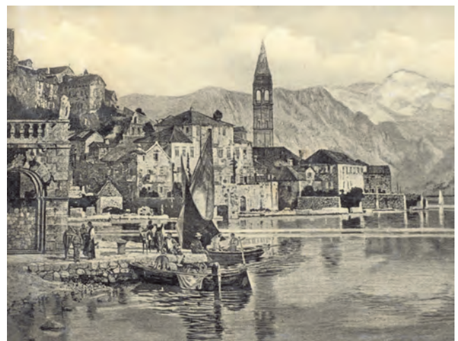
Slika 108. Nekadašnji izgled palate Smekija

Kao pomorci, pomorski ratnici i privrednici članovi porodice Smekja javljaju se veoma rano, već u