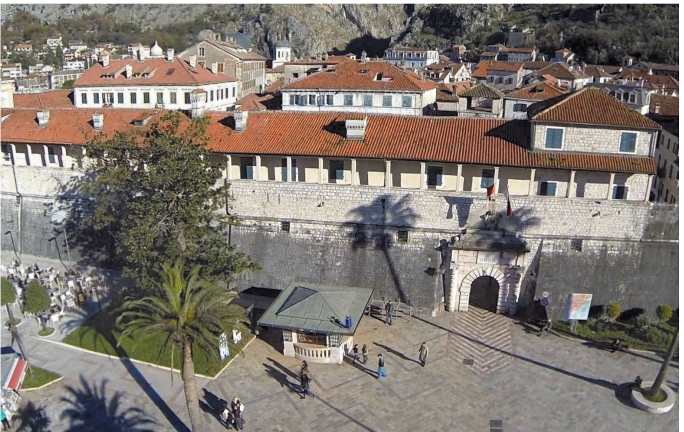
Slika 53. Današnji izgled Providurove palate – pogled iz vazduha sa spoljne strane glavnih gradskih vrata

skulptorskih ukrasa. Jedini ukras su renesanse konzole (15) koje pridržavaju dugački balkon (55 m), jedan od najdužih balkona na jugoistočnoj jadranskoj obali. Tokom italijanske okupacije Kotora 1941–1943. godine uništena je lijepa kamena ograda sa stubovima, radi ulaska vojnih vozila u grad, koju pamtimo na osnovu brojne fotodokumentacije. Poslije rata, 1955. godine, zbog otvaranja novih radnji na ovom prostoru, umjesto prozora sa rešetkama otvorena su nova vrata, njih petnaest sa lučnim otvorima, a preostala su dva originalna portala iz XVIII vijeka, koja su pozicionirana iza svakog petog novog otvora. Iznad glavnog, sjevernijeg starog portala u bunjatu, postavljen je grb sa štitom, providura Frana Đorđija (1709–1711).