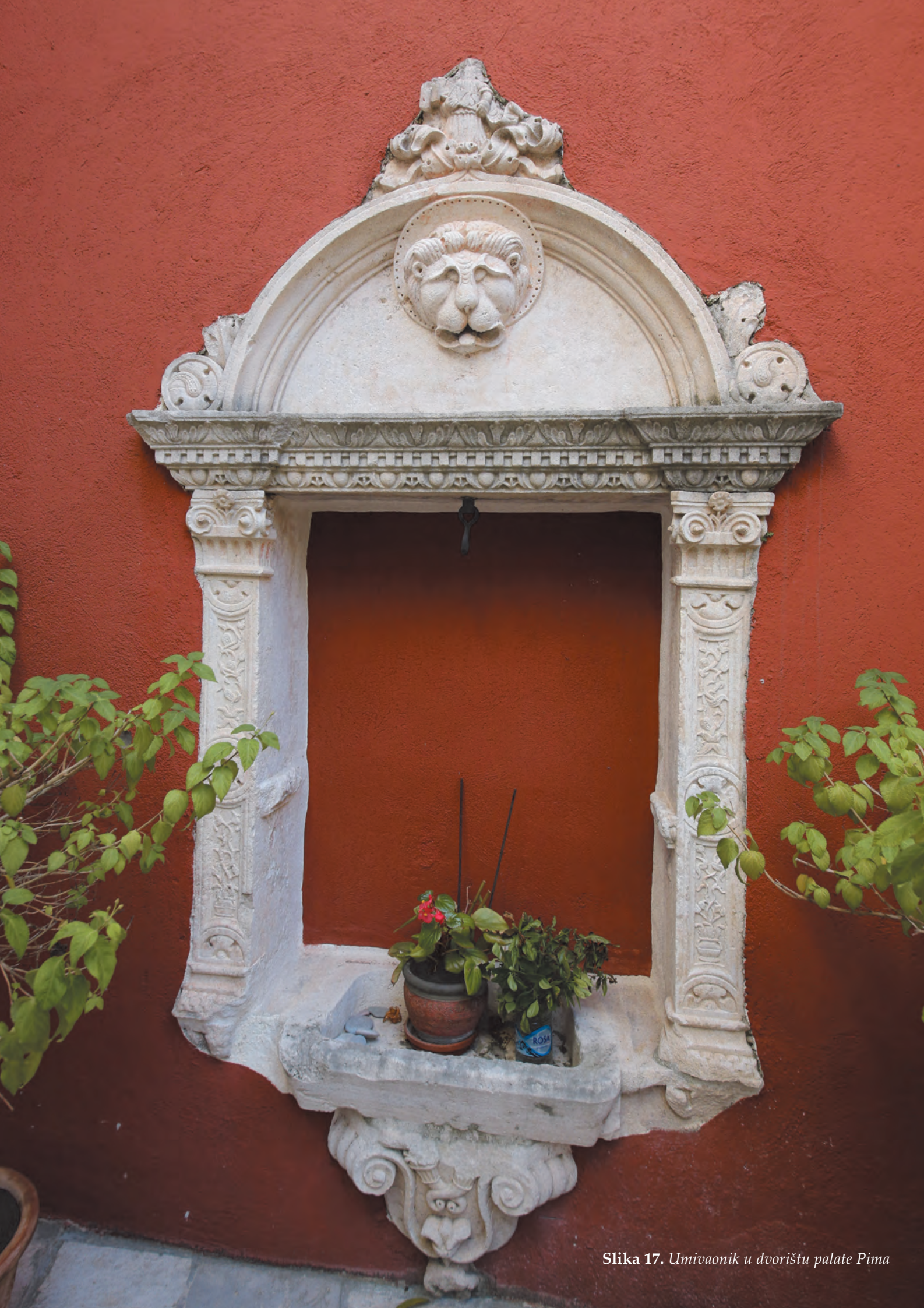
Slika 17. Umivaonik u dvorištu palate Pima