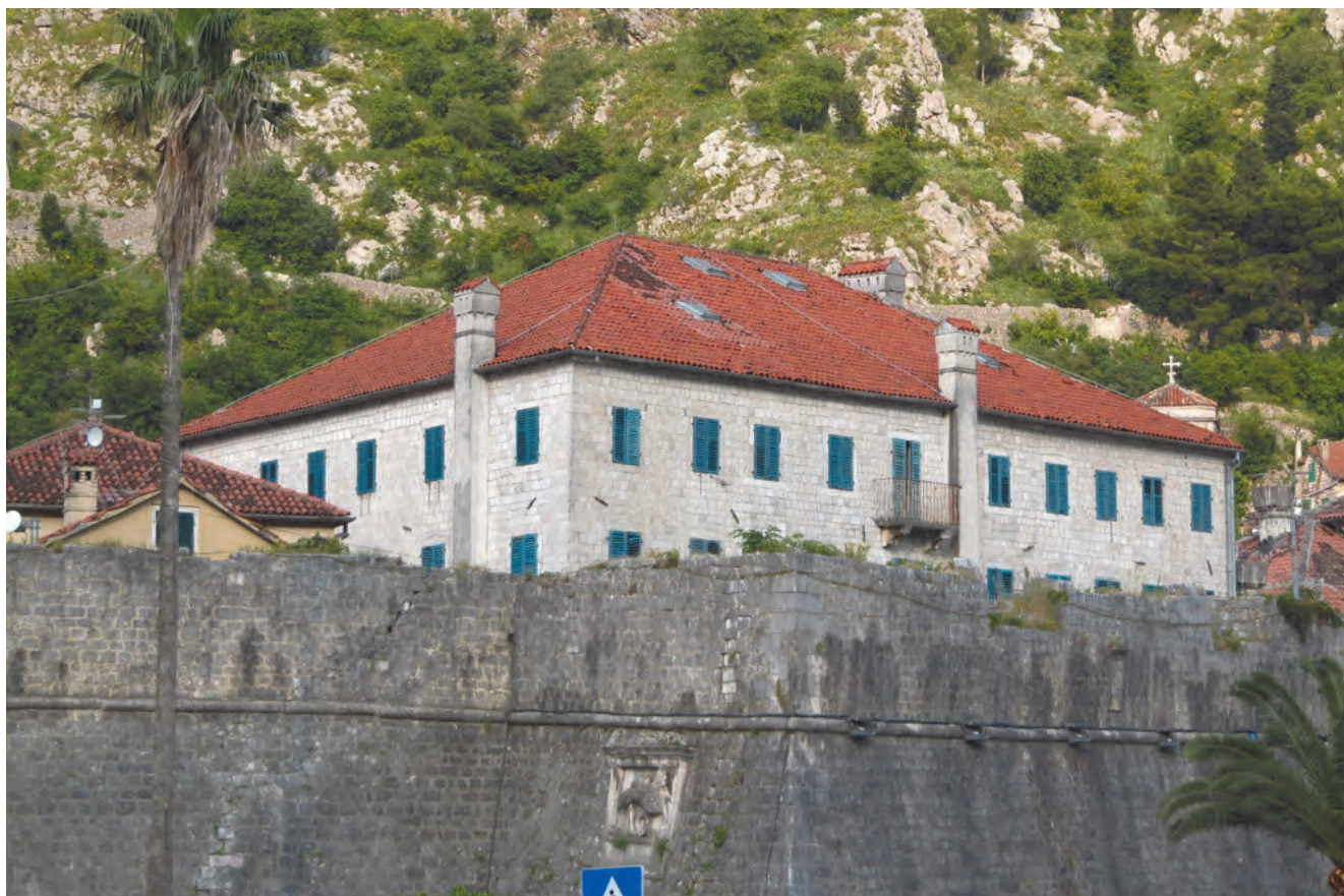
Slika 28. Današnji izgled palate Beskuća sa spoljnje strane bedema