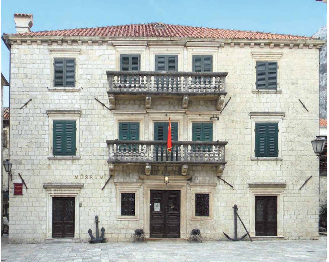
Slika 64. Današnji izgled palate Grgurina