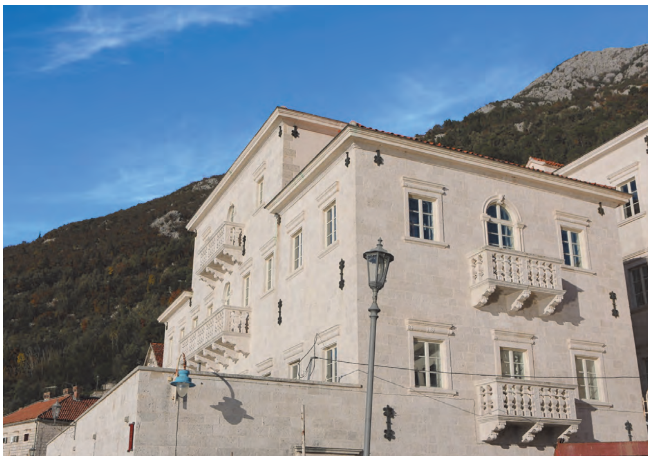
Slika 110. Palata Smekja, pogled sa jugozapada