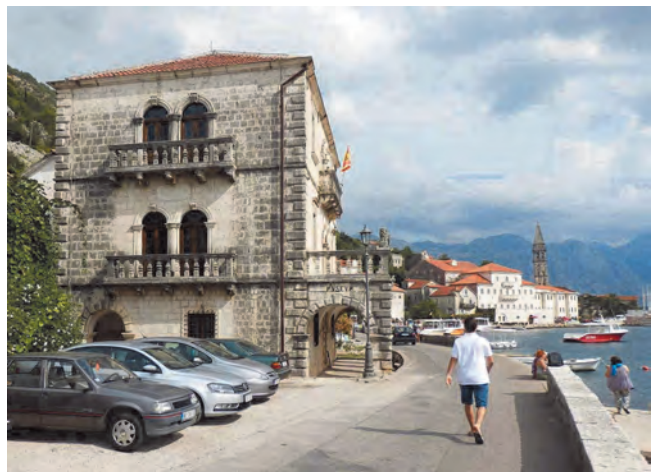
Slika 117. Sjeverna fasada palate Bujović, današnji izgled