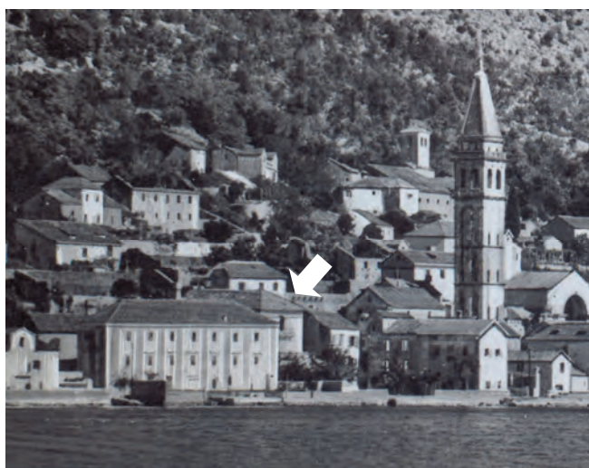
Slika 99. Pogled na palatu s mora, stara fotografija

Vlasnici palata, potomci po ženskoj liniji, Grego-Brajković, gornje etaže koriste za stanovanje, a u prizemlju je ugostiteljski objekat sa predivno uređenim dardinom.