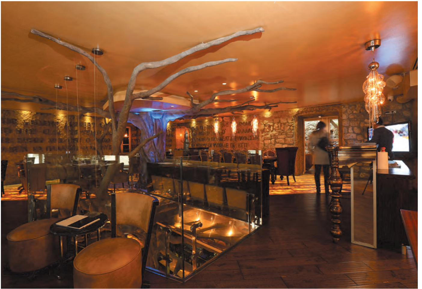
Slika 6. Enterijer hotela Astoria