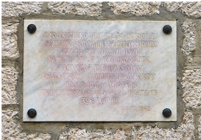
Slika 62. Ploča sa pomenom stare apoteke postavljena 1952.

apoteke iz 1326. godine. Ploču je postavilo Naučno društvo za istoriju medicine, farmacije i veterine Jugoslavije. U ovoj kući stanovao je gradski apotekar Marko Paolo iz Venecije 1395. godine, jer je kuća bila mirazna imovina njegove žene. Iznad ovog amblema isklesan je vrlo lijep hristogram, oivičenim lovorovim vijencem, sa ukusno izvijenim volutama, po sredini kružnog vijenca, sa lijeve i desne strane. Hristogram, koji takođe aludira na trijumf života nad smrću, simbol je zaštite kuća od zemljotresa, kuge, bolesti. Iznad hristograma je lijepo profilisani kameni ispust sa oblom i ravnom gornjom graničnom linijom, ispod kojih su isklesani krugovi u nizu. Danas se na zgradi ne nalazi