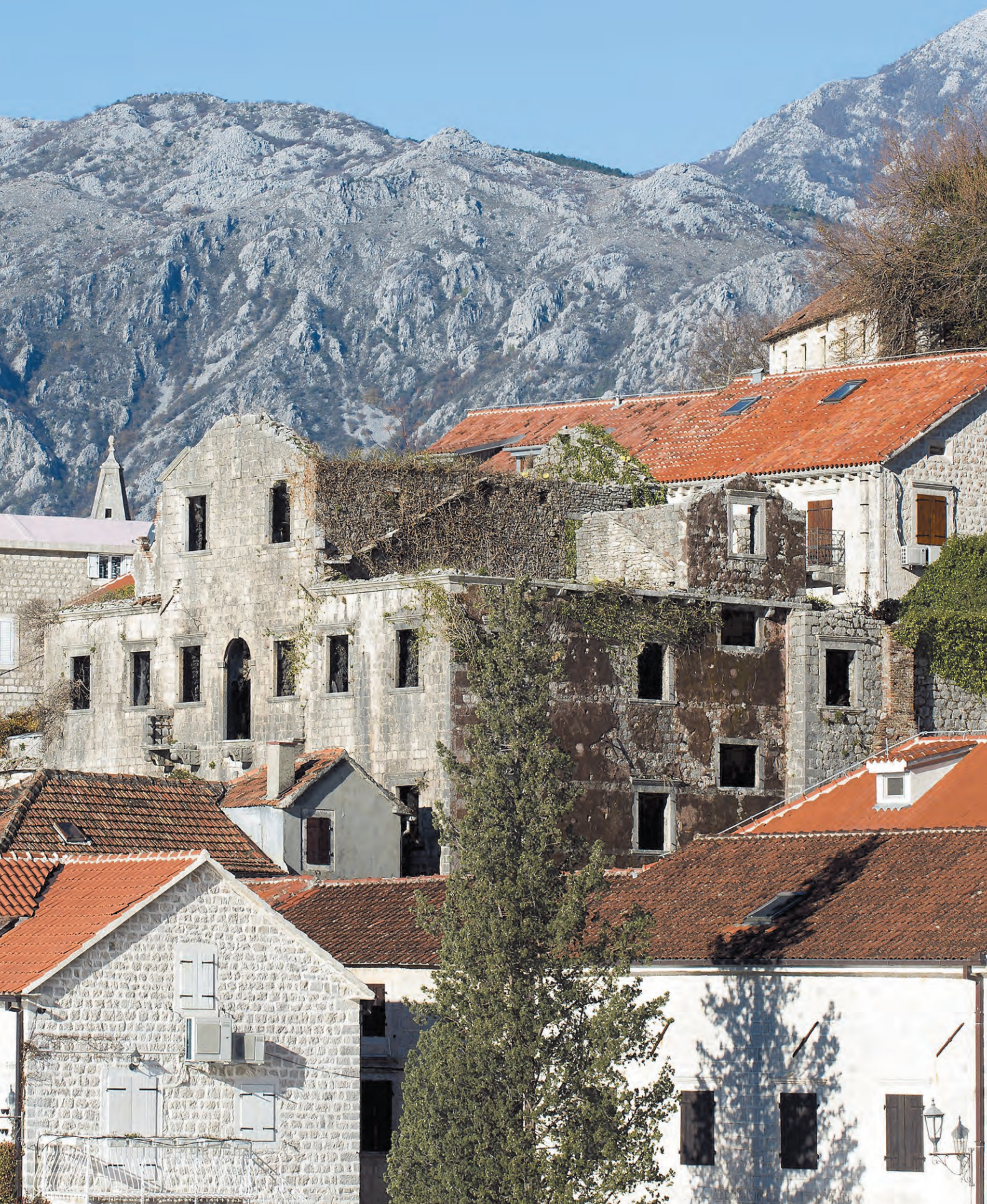
Slika 88. Današnji izgled palate Mazarović sa okruženjem