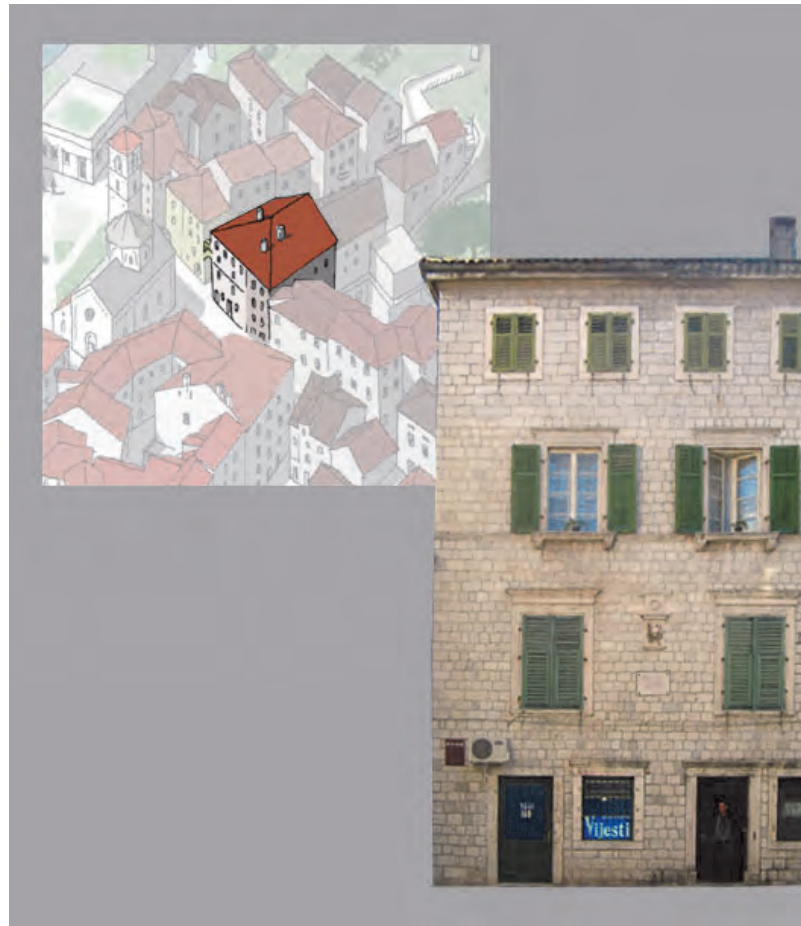
Slika 63. Položaj palate Grubonja

Zgrada danas služi u stambene svrhe, a u prizemlju su butik i suvenirnica. Od dva portala sa prozorima na desnoj strani, prvi je jednostavne profilacije, dok je prozor do njega sa gornjom gredom isturenom upolje. Druga vrata i prozor, desno od njih, nadvisuje jedna kamena greda.