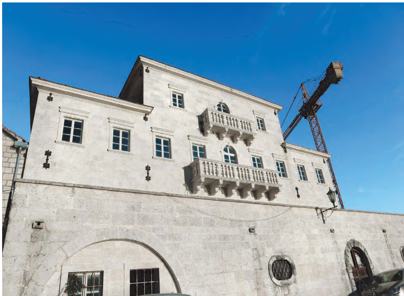
Slika 109. Pogled na zapadnu fasadu palate Smekja