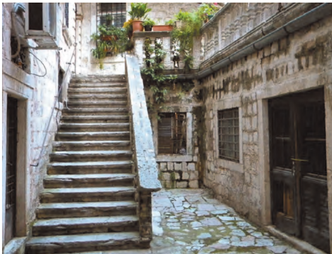
Slika 21. Izgled dvorišta palate