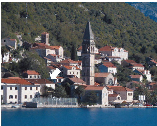
Slika 100. Pogled na palatu s mora, nova fotografija