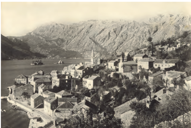
Slika 84. Panorama Perasta sa pogledom na palatu (1954)

U spisima grada Kotora ova se peraška porodica pominje vrlo rano, već 1334, a u Perastu su poznati već u XV vijeku. Smilje, kao motiv porodičnog grba, simbol besmrtnosti, sačuvan je na palati i na kuli