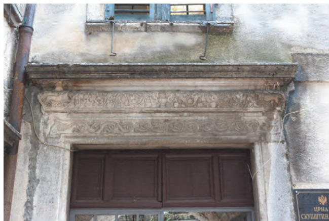
Slika 20. Glavni portal palate porodice Bizanti

U isto vrijeme barokizirana je i unutrašnjost palate. Rekonstrukcija izvornog enterijera, koji je zatečen prilikom revitalizacije zgrade od posljedica katastrofalnog zemljotresa, 1674. godine, u to vrijeme uslovala je smanjivanje izvornih prostorija. Rekonstruisana izvorna tavanica u zapadnoj sobi prvog sprata posjeduje raskošno rezbaren drveni plafon, jedini do danas sačuvan u Kotoru. Pokrivao je, od postanka ovog originalnog dijela palate, niz kamenih konzola međuspratne tavanice i primarne „bankine“, grede nosače, na njima i do polovine njihovog raspona. Dva sačuvana polja tavanice, smanjena za dva ista polja tokom pomenute restauracije 1674. godine, ukrašena su profilisanim grednim vijencem od dasaka, sa pojasom