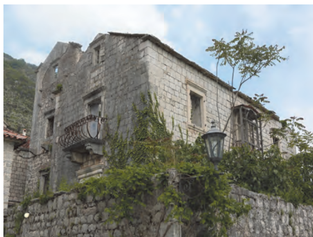
Slika 96. Pogled na palatu iz neposredne blizine