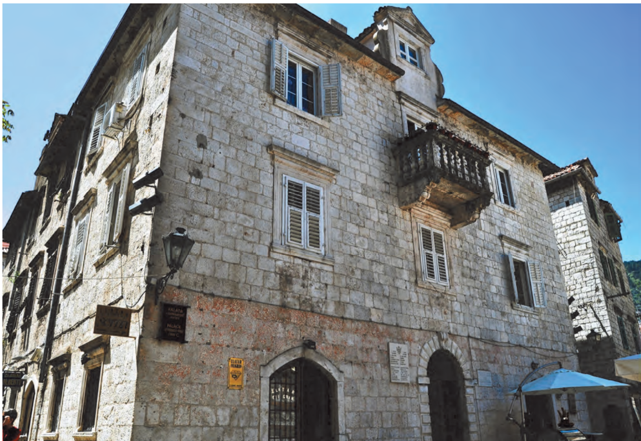
Slika 73. Izgled palate Lombardić prije posljednje restauracije

fasada smještene su, takođe, vidionice „viđenice“, koje su postavljene po istoj horizontali. Na glavnoj, sjevernoj fasadi, čiji se glavni portal, rađen u bunjatu ulazi se preko tri stepenika, i ovdje nisu bila dva, danas postojeća, sporedna portala, već su tu prvobitno stajala dva prozora, za magazinske prostore. Na prvom spratu su tri prozora barokne profilacije, koja se nalazi na svim prozorima palate, a na drugom