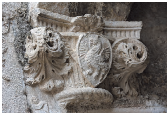
Slika 44. Zmaj, simbol grba porodice Drago