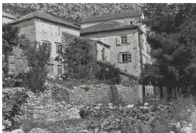
Slika 91. Palata Balović, bočni izgled, stara fotografija