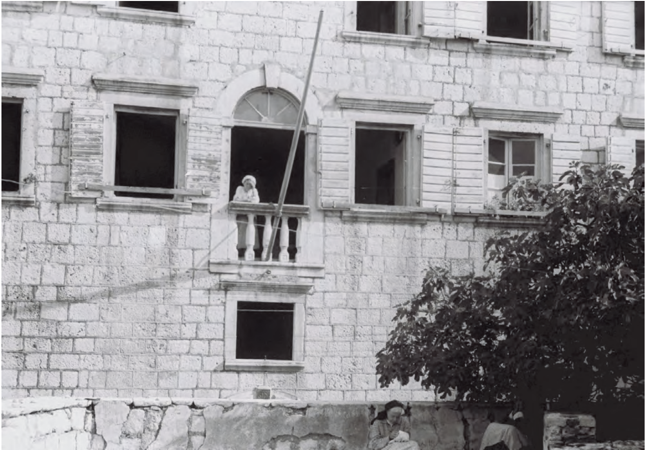
Slika 92. Pogled na fasadu sa jednom od stanovnica palate

Helena“, poznatiju kao „Noć skuplja vijeka“. Predanje kaže da ga je na to podstakla ljepota kćerke kapetana Balovića.