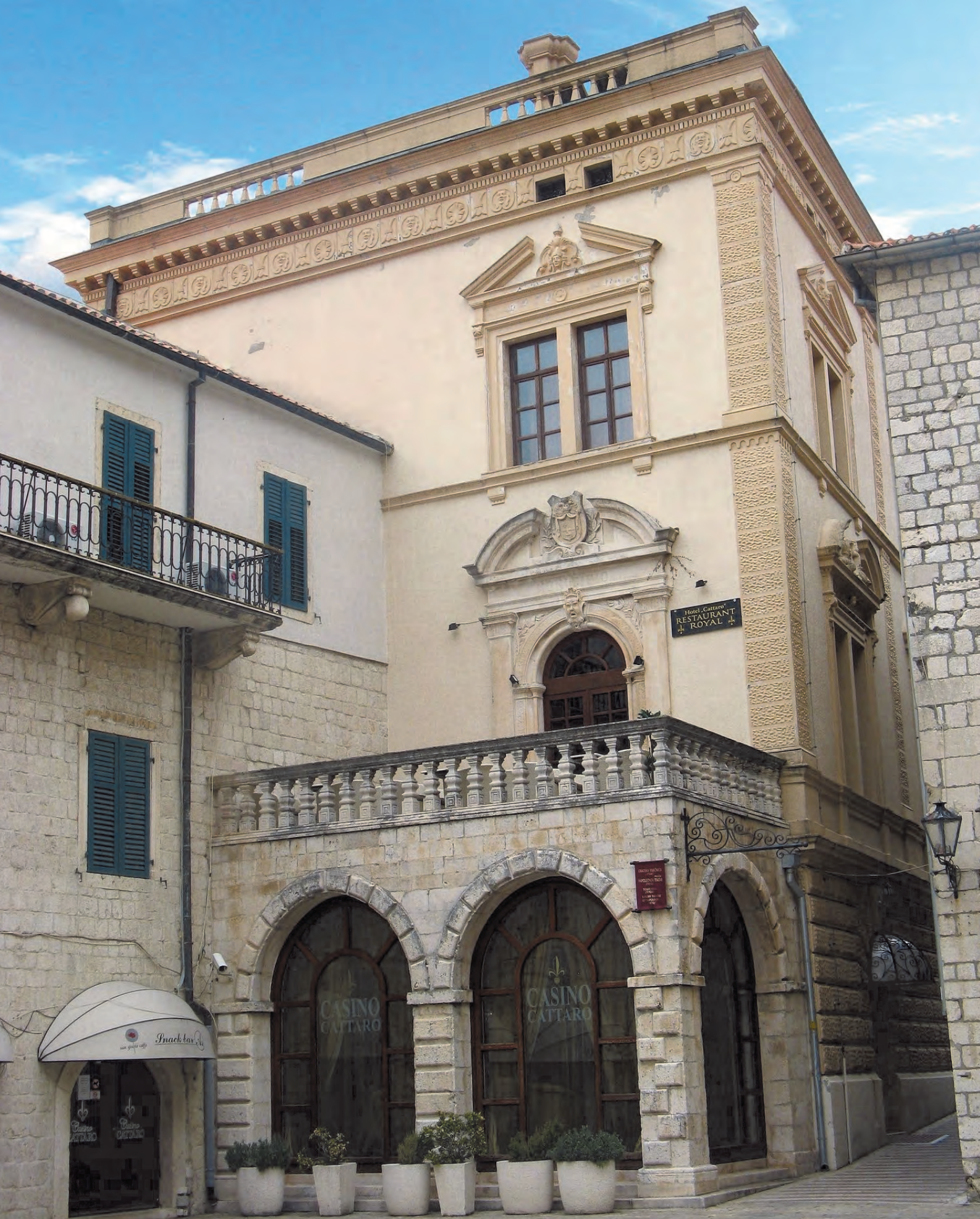
Slika 49. Nekadašnja Gradska vijećnica – danas hotel „Cattaro“