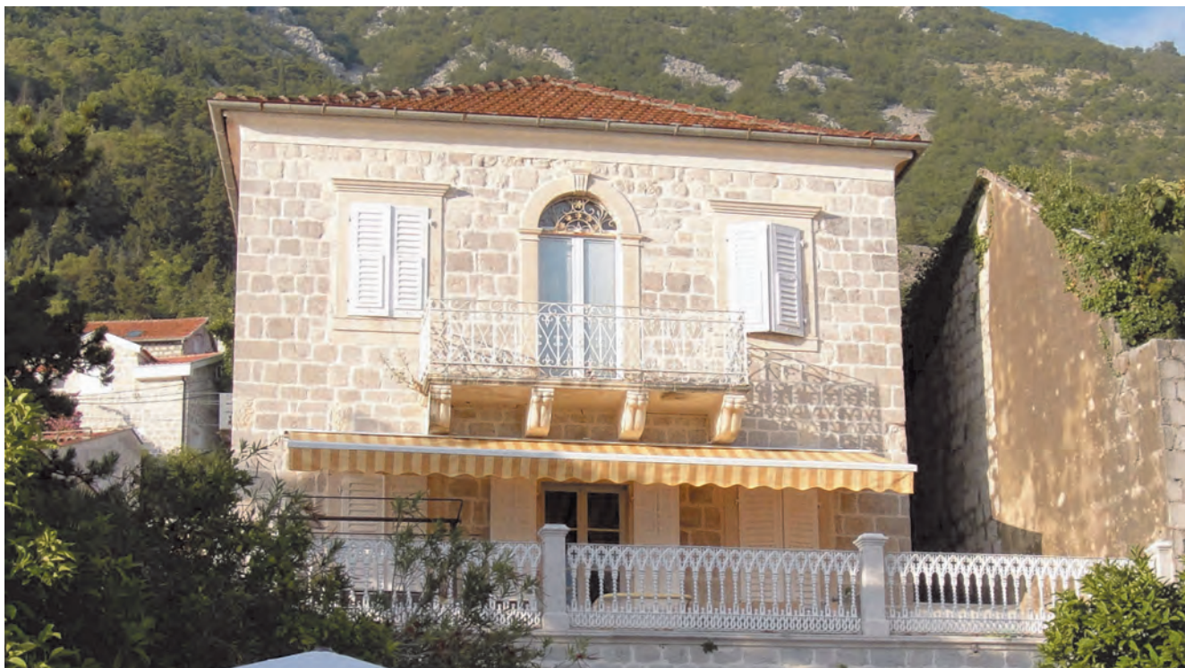
Slika 98. Današnji izgled palate Brajković-Martinović