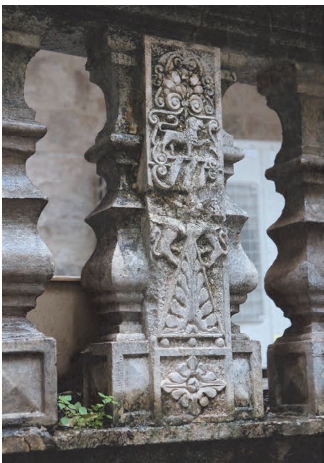
Slika 23. Detalj sa ograde terase

floralnog motiva, konzolama i trakama sa motivima kime i astragala, te uz kamene profilisane portale, na kojima su isklesani porodični grbovi i motivi, predstavljaju jedine originalne elemente ovog nekada prvoklasnog plemićkog zdanja. Arhitektonska organizacija prostora u unutrašnjosti palate – prije svega prvi sprat, glavna etaža palate – koncipirana je po principu piano nobile , koji je karakterističan i za ostale plemićke palate. Reprezentativna glavna sala morala je biti većih dimenzija, sa zidnom dekoracijom, slikama, uglavnom biblijskog sadržaja, koje su uvožene iz Venecije, ili radova istih majstora koji su na našoj obali ukrašavali plemićke domove. Podovi soba sastojali su se od dijagonalnih tavela, sastavljenih u obliku šahovskog polja, braon i oker kombinacije, a u bočnim odajama od manjih pravougaonih oblika, sastavljenih u obliku riblje kosti. Pronađeni su i podovi iz novijih faza palate rađeni u stilu venecijanskog teraco poda, koji liči na mozaik, a zapravo je rađen mješavinom maltera, tucane opeke, oblutaka bijele, crvene i zelene boje, korišćenih za površine, crvenog za borduru i bijelog za ivicu koja se odvajala od poda.