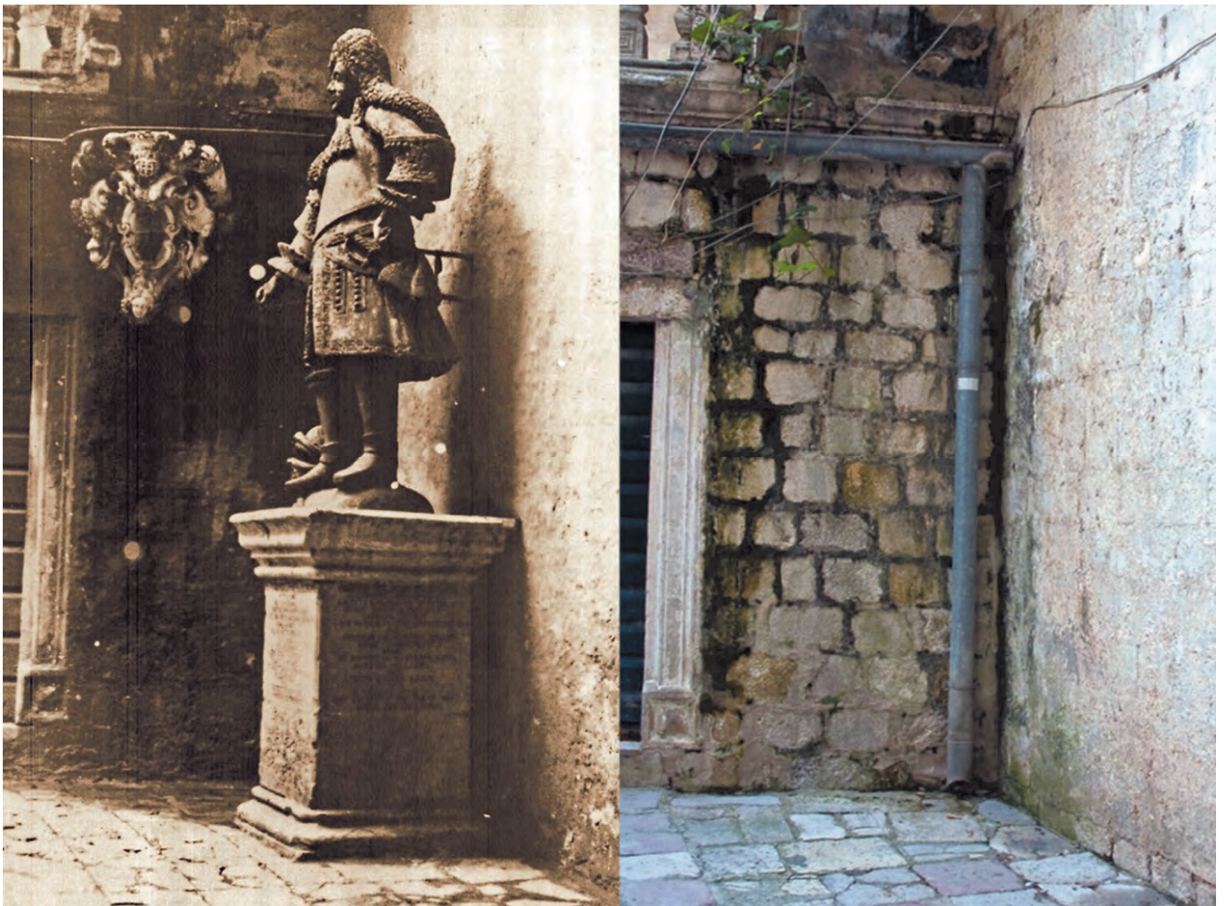
Slika 25. Skulptura Pietra Duodo, mletačkog providura iz 1691.