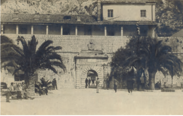
Slika 50. Nekadašnji izgled Providurove palate sa spoljne strane glavnih gradskih vrata