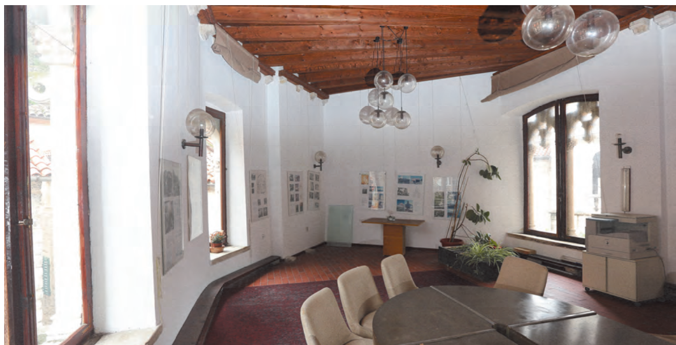
Slika 47. Gotička sala palate Drago, arhitektonski atelje