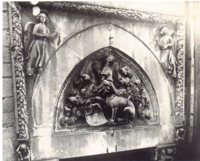
Slika 30. Luneta nad portalom palate, nekadašnji izgled

Ova luneta zapravo je izvorno portal prvobitne palate porodice Bizanti, koja je već uveliko ekonomski posustala, dok su Beskuće zgradu ili preuredile ili kupile, a možda im je samo pripisana u javnosti bez prave pozadine, jer u popisu građana Kotora od 1760. do 1820. godine Beskuća se ne navodi kao stanovnik Kotora, nastanjen u ovoj palati, a prema zemljišnim knjigama iz 1832. godine ne navodi se ni kao njen vlasnik. Bilo kako bilo, Beskućama se ovo zdanje pripisuje prema predanju i zgrada je danas poznata pod nazivom Beskuća, tako da se uz priču o njoj obavezno nadovezuje i istorija porodice Beskuća, koja relativno kasno stiće plemićki status. Iako postavljen visoko, i ovaj reljef stradao je tokom rušilačkog divljanja u proljeće 1945, doduše, na sreću ne u potpunosti, jer se smatralo da su i to mletački lavovi, a ne simboli stare, ugledne plemićke porodice Bizanti. Stradao je lav na kruni perjanice grba ove porodice, a lavu koji drži štit oštećeno je lice i jedna šapa. U ovoj su se zgradi nalazile kancelarije Okružnog i Sreskog suda, pošto je početkom XIX vijeka palata pripala opštini Kotor. U palati, koja je dobila funkciju sudske zgrade,