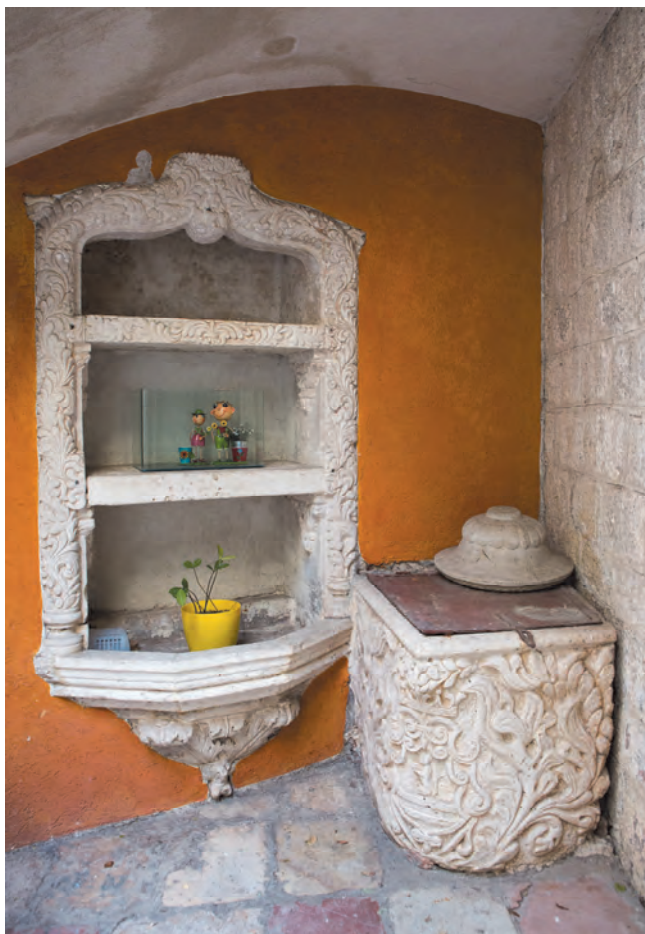
Slika 57. Umivaonik i bunarska kruna u dvorištu palate