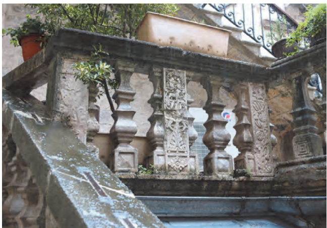
Slika 22. Ograda terase sa balustradom