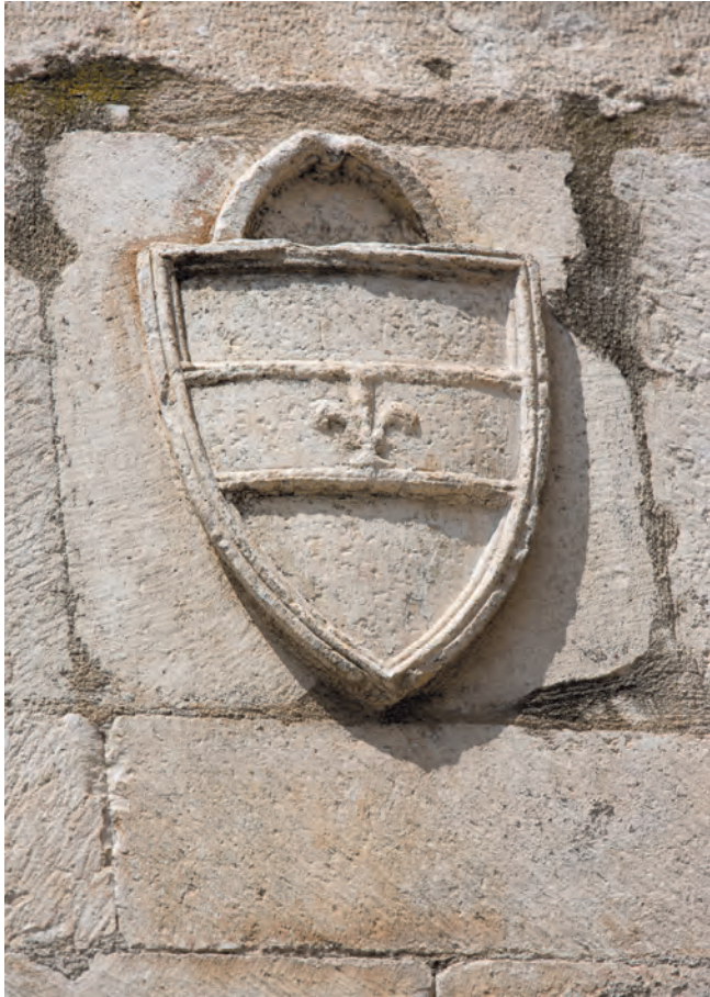
Slika 3. Grb porodice Buća