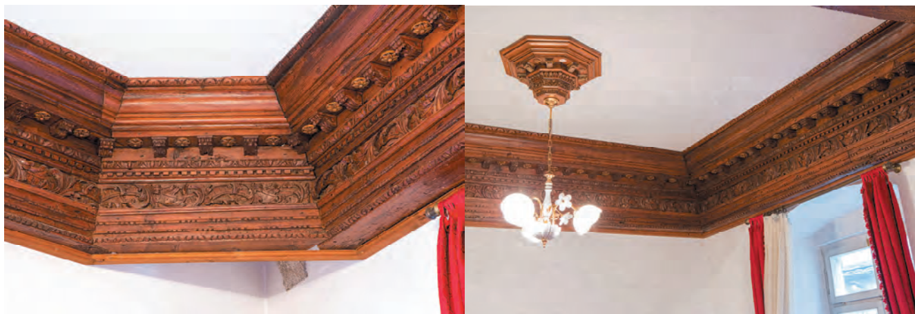
Slika 26. Rekonstruisani izgled originalne tavanice

jer su na desnom vidljive krljušti. Greda iznad ove posjeduje vegetabilni preplet, kantaros po sredini i lavovske figure lijevo i desno. Završna greda izvučena je upolje i stepenaste je profilacije. Od svih većih kotorskih palata palata Bizanti ima najmanje ukrasnih detalja na fasadama, ne posjeduje gotovo nijedan ukras osim uglavnom ritmično raspoređenih prozorskih otvora.