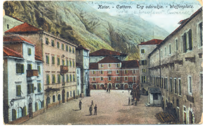
Slika 51. Nekadašnji izgled Providurove palate sa Trga od oruzja