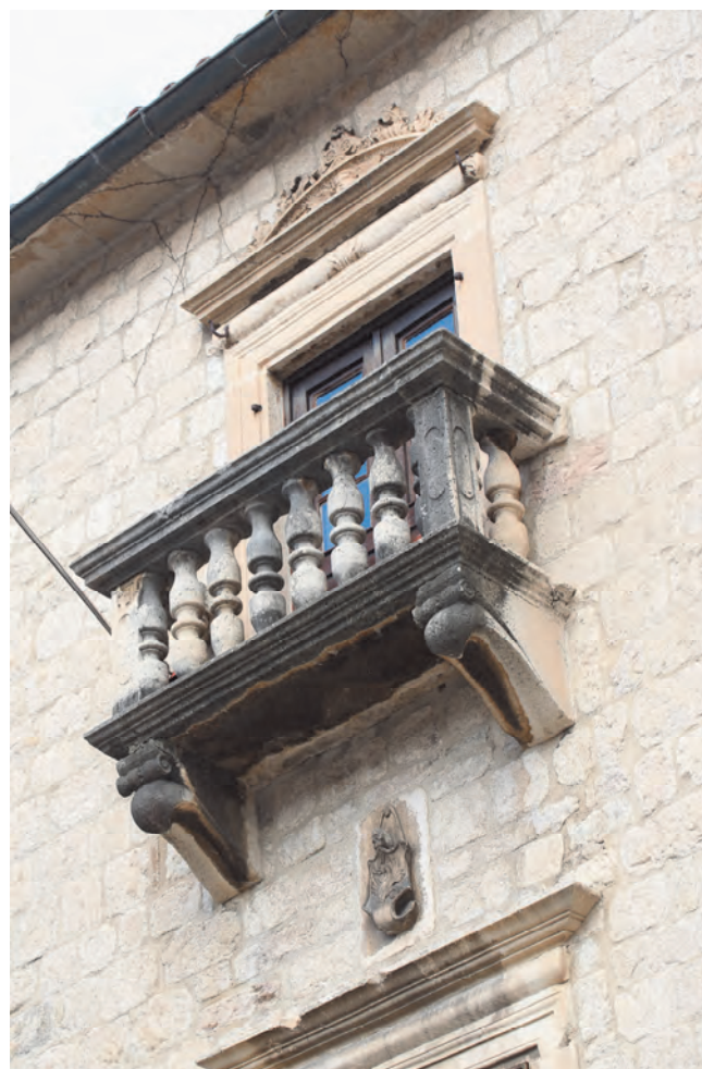
Slika 45. Južna fasada izvučena prema trgu Sv. Tripuna