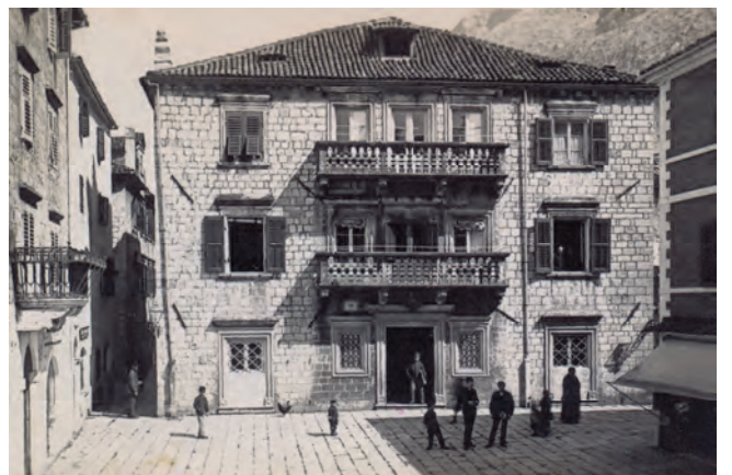
Slika 65. Nekadašnji izgled palate Grgurina

primjera sačuvane barokne arhitekture u gradu, u svom tlocrtu ima izgled nepravilnog pravougaonika. Projektant palate je najvjerovatnije mletački arhitekta nama nepoznatog imena, a graditelji su bili domaći protomajstori i majstori. Vjerovatno je i ova palata, poput palate Pima, imala svoju drvenu maketu. Okrenuta u smjeru sjever-jug, glavnom južnom fasadom