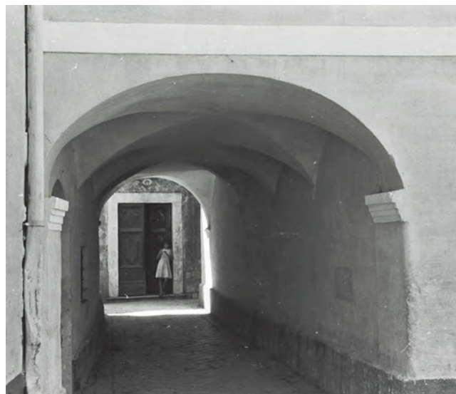
Slika 33. Nekadašnji izgled zasvođenog tunela koji vodi ka palati Vrakjen

Iako je spoljašnjost palate skromna, ona je, pomenuto je, u enterijeru pravi dragulj neoštećene izvorne