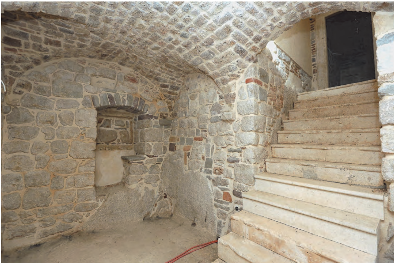
Slika 122. Pogled na podrumske prostorije palate Zmajević