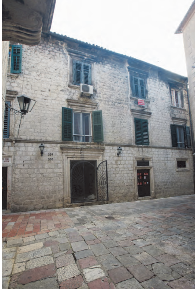
Slika 54. Spoljni izgled sjeverne fasade palate Jakonja

nosači greda, odnosno svodova. Danas je prolaz zatvoren i zasvođen poluobličastim krstastim svodom, slično kao na ulaznom tremu palate Pima.