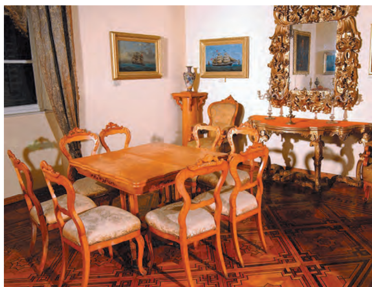
Slika 69. Sadašnja muzejska postavka, salon porodice Florio sa Prčanja

Od svih elemenata plastičnog ukrasa palate Grgurina posebnu pažnju treba obratiti na balkonske ukrase glavne, južne fasade i prvog sprata sjeverozapadne fasade, koji gleda na unutrašnje dvorište. Na sjevernoj fasadi, u nivou konzola prvog sprata ugrađen je još jedan porodični grb, simbol grada Kopra,