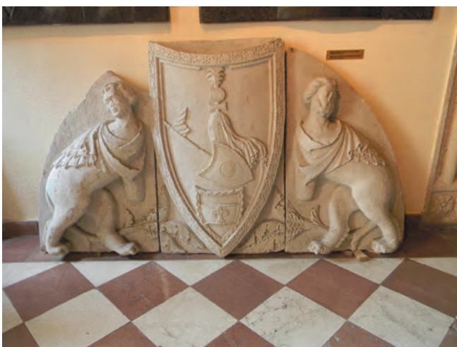
Slika 5. Luneta sa portala porodice Buća

Sa ove palate danas se u holu Pomorskog muzeja Crne Gore nalazi veliki kameni timpanon, visokoreljefni triptih, klesan u romaničkom maniru sa primjesama gotike. Po sredini triptiha u dekorisanom štitu prikazan je konjanik sa štitom i oklopom na glavi okrenutoj u poluprofilu, koji u ruci nosi koplje sa barjakom na vrhu, a na samom šiljastom završetku pri dnu štita isklesan je grb porodice, stilizovan ljiljanov cvijet. Sa lijeve strane je neobično mitsko biće, plod mašte, bezimenog kamenoresca, sa tijelom lava i glavom muškarca, uzdignuto na zadnje noge i čvrste gipke šape. Dugačak savijen rep završava se stilizovanim listovima krupnog, razlistalog bršljana. Na leđima je plašt sličan krilima slijepog miša. Mladi čovjek i atipični grifon sa životinjskim trupom i neobičnim plaštom simboli su mlade grane porodice Buća, koja je u cvjetanju, punom radnom i životnom usponu. Desno je, uklapajući se u bočnu, zaobljenu stranu timpanona, istovjetna u prikazu tijela, nešto voluminoznija figura, ali je glava figure bradat čovjek, guste kose, s licem, ne mladičkim, već zrelim, zamišljenim pod teretom godina i iskustva. Starija, pa ipak jedra predstava zrelog muškarca, simbol je stare grane porodice koju veliča slava, činilo se beskonačno trajanje jedne od najvitalnijih plemićkih porodica drevnog Kotora.