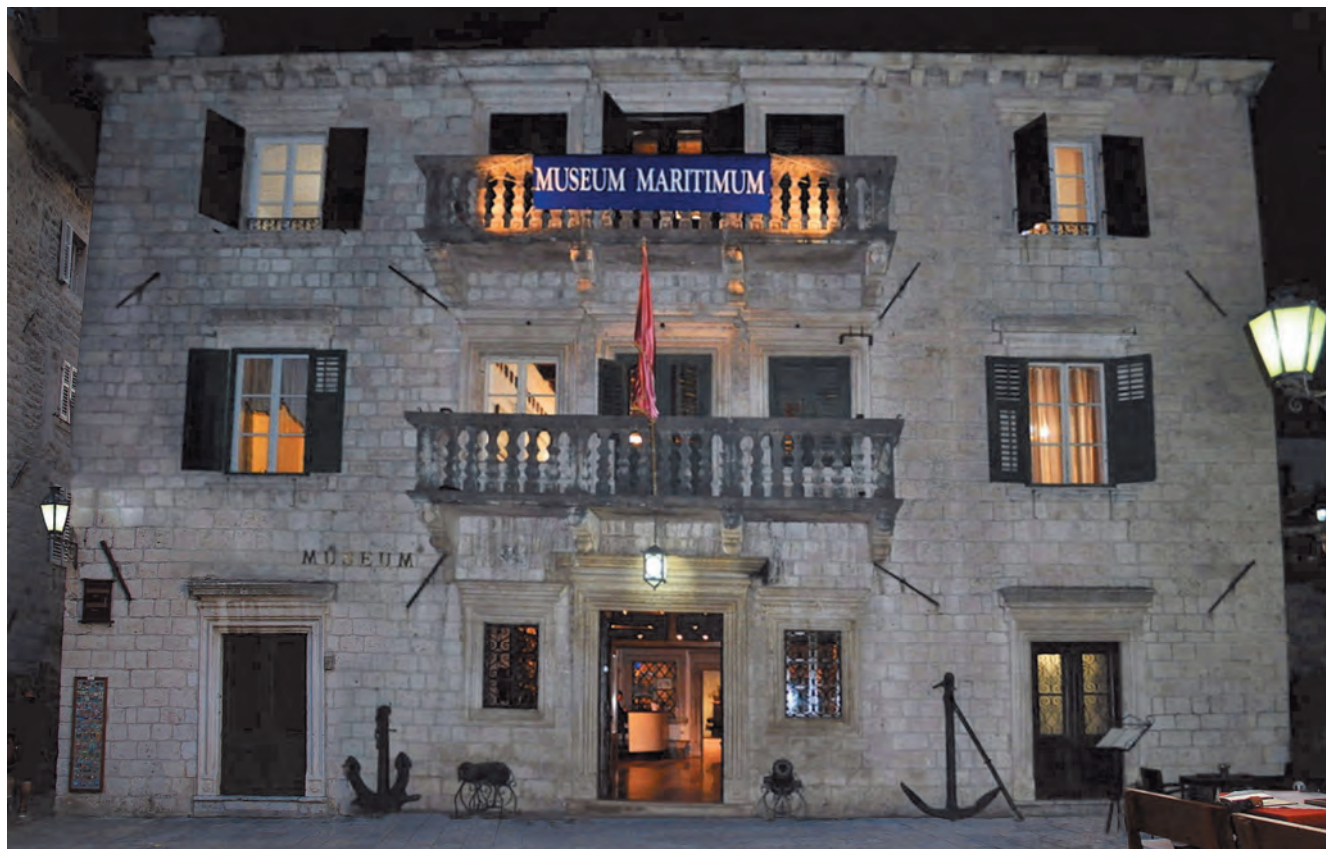
Slika 70. Izgled Pomorskog muzeja noću