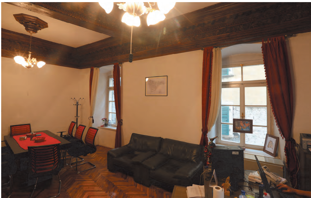
Slika 27. Enterijer palate Bizanti

određenu asimetričnost fasadi. Ispod krova, ispod dvoslivnog krova, nalazi se mali prozor. Ova sjeverna fasada produžava se prema uskoj ulici okrenutoj hotelu „Vardar“. Na drugom spratu je sedam prozora, od kojih je četvrti neposredno poviše rasteretnog luka koji zgradu vezuje sa bočnom, južnom stranom hotela. Ispod, na prvom spratu, nalazi se šest prozora, a u prizemlju 4 portala i po jedan magazinski prozor. Zapadna fasada, okrenuta uskoj ulici koja vodi do Trga od brašna, zajedno sa blagim prelomom sa južne strane ima po pet istih prozora na prvom i drugom spratu i pet portala lučne profilacije, od kojih je peti dograđen 1894. godine. Između trećeg i četvrtog prozora na prvom spratu nalazi se granulirani okvir sa grbom porodice Bizanti. Na uskoj južnoj fasadi prema glavnom portalu na prvom i drugom spratu nalaze se po jedan prozor barokne profilacije, a u prizemlju