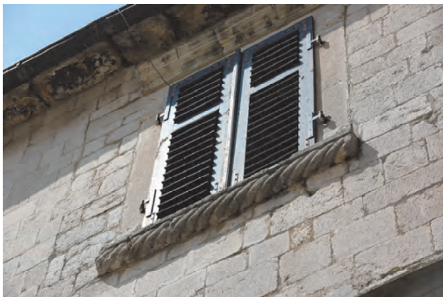
Slika 4. Prozor sa tordiranim potprozornikom palate Buća