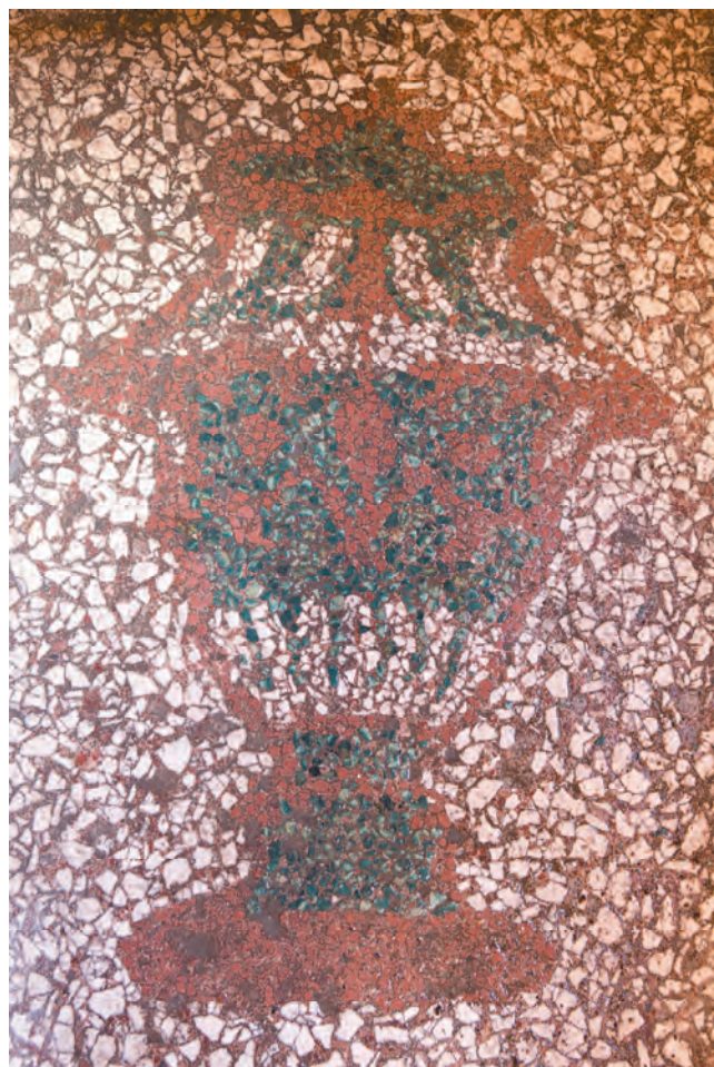
Slika 36. Kantaros, srednjevekovni simbol izvora života