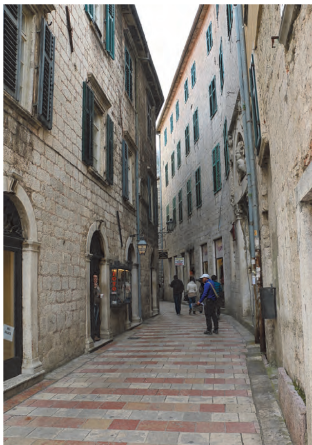
Slika 29. Današnji izgled palate Beskuća sa ulice

visine glavnog portala sa zelenim drvenim vratima, ima jednu od najljepših luneta u stilu plamene gotike na jugoistočnoj jadranskoj obali, isklesanu u dubokom