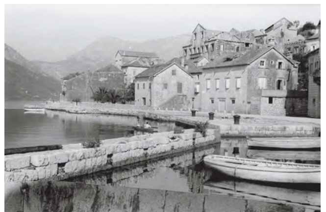
Slika 85. Detalj mandrača sa pogledom na palatu