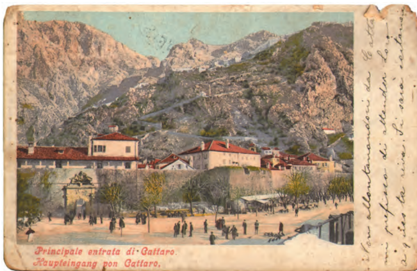
Slika 31. Stara razglednica sa izgledom palate Beskuća

Porodica Beskuća je, kupujući brojne posjede u Boki, dobijanjem plemstva, dobila i svoj grb – zmiju omotanu oko stabla, koja u ustima drži dijete sa devizom, koju su imale gotovo sve plemićke porodice: Si deus cum nobis, quis contra nos – Ako je Bog sa nama, ko će protiv nas . U svojoj palati na Prčanju Beskuće su okupljale internacionalnu gospodu, sa kojom su dijelile prijateljske i interesne veze. Tokom 1878. godine, u vrijeme burnih političkih previranja, kada je međunarodna ratna mornarica demonstrirala protiv Turske, kako bi ustupila gradove Bar i Ulcinj Crnoj Gori, braća Beskuća priredivala su komandantima lađa prijeme u svojoj palati na Prčanju. Kod njih su tajno dolazile u posjete i austrijske nadvojvode. U prilog slavi i ugledu, kao i visokom materijalnom statusu koji je ova porodica imala u doba Mletačke Republike, govori i podatak da je književnik Stefan Mitrov Ljubiša u jednoj svojoj priči uvrstio nekog Beskuću kao providurovog povjerenika u odnosima između njega i naroda.