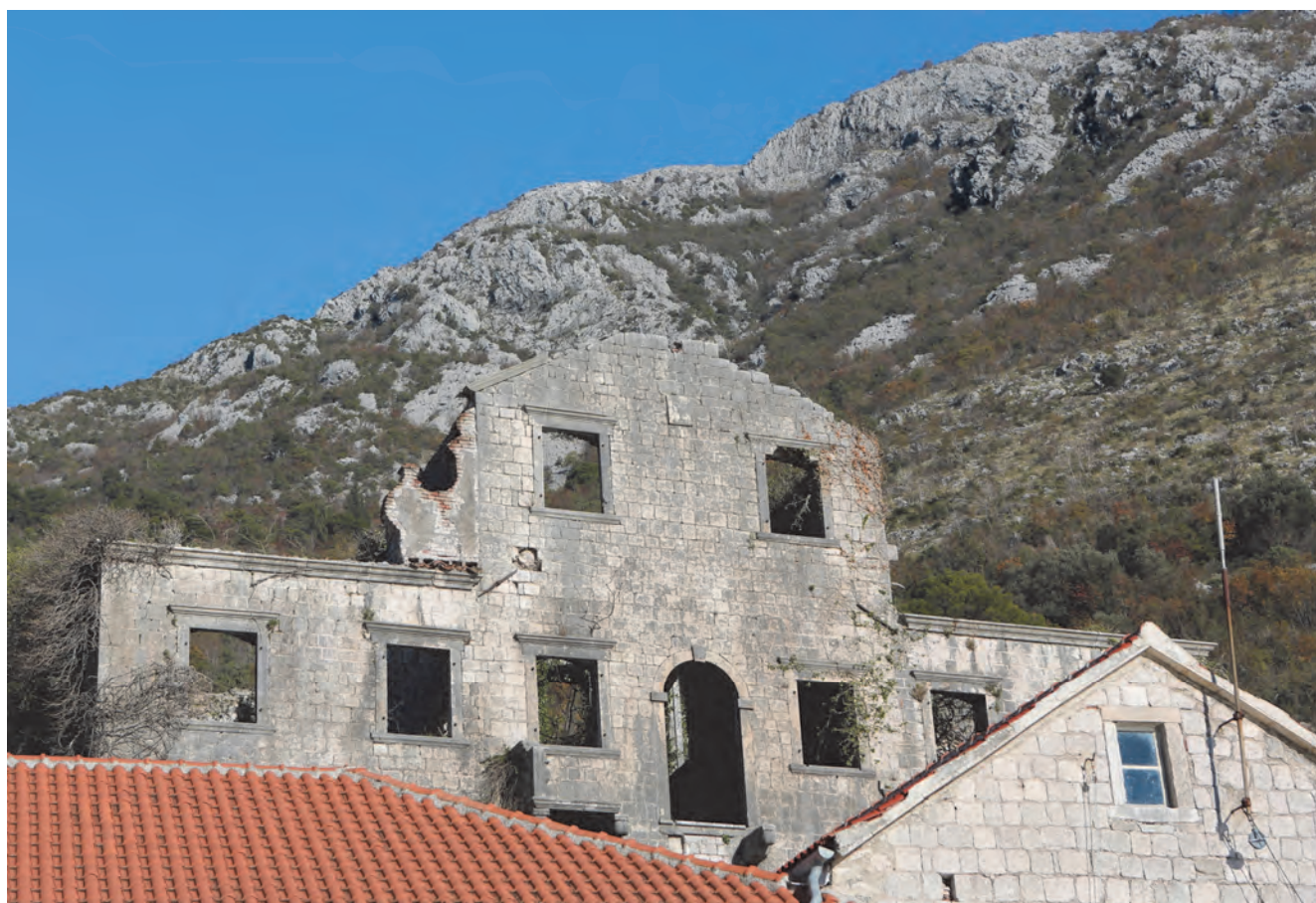
Slika 87. Dio pročelja palate Mazarović, današnji izgled