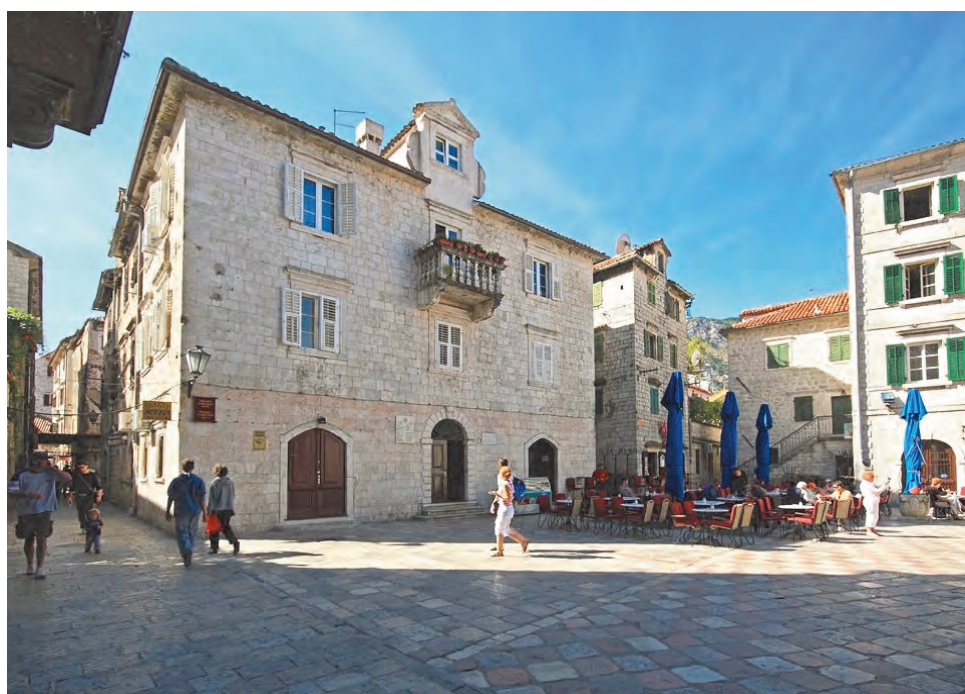
Slika 74. Sjeverna fasada palate sa pogledom na ulicu koja vodi do pjace od Muzeja

spratu u liniji portala i centralnog prozora prvog sprata, nalazi se portal koji izlazi na balkon od korčulanskog kamena sa ukrasnom balustradom, koji je postavljen na dvije dvostruko savijene dekorativne volute. Južna fasada palate koncipirana je daleko raskošnije, jer su na drugom spratu, paralelno dva balkona od korčulanskog kamena, postavljena na konzole od dvostrukog akantusovog lista, sa strana plitke