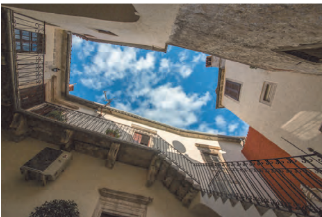
Slika 15. Stepenište ka prvom spratu

Sačuvano je i unutrašnje dvorište renesansnog tipa sa stepeništem, sa biranim rastinjem, maslinom zasađenoj u kamenom pilu, neposredno do ulaza kroz zasvođeni bačvasti svod, jasminima u omanjim pilima i stablom kamelije pored bunarske krune. Ispod luka drugog stepeništa nalazi se gotsko-renesansna bunarska krana, koja je smještena neposredno iznad donjeg bunara, originalnog izvora vode zatvorenog poput prozora, lijevo, ispod gornje terase. Iza bunarske krune je kitnjasto dekorisana kamenica, umivaonik, sa fitomorfnim detaljima i glavom mletačkog lava u anfasu, okrunjenog nimbom, ispod nadvišenog luka.