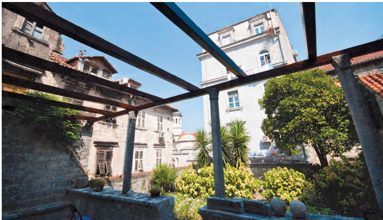
Slika 66. Terasa i vrt sa sjeverne strane palate Grgurina

široke kulture i visokih estetskih kriterijuma. Njena glavna, južna fasada građena je od lijepo koncipiranih pravougaonih tesanika korčulanskog kamena, ujednačeno polirane površine. Pročelje po vertikali i horizontali obrazuju simetrično, ritmično ponavljani otvori, koji odišu ravnotežom i harmonijom, reminiscencijom na renesansnu arhitektonsku koncepciju, ali i kao daleki eho romano-gotičkog stila. Ipak, palata Gregorina odiše duhom nove, barokne epohe, brojnošću otvora, gomilanjem ukrasa i stavljanjem akcenta na arhitektonske elemente, balkone ili terase i portale, kao centralne motive. Veliki balkoni centralne, južne fasade,