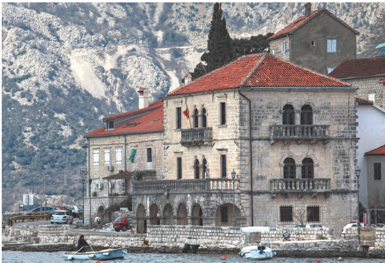
Slika 113. Današnji izgled palate Bujović