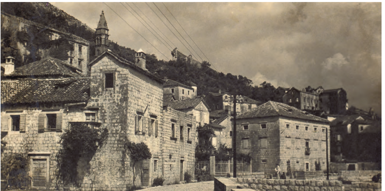
Slika 112. Ulica sa pogledom na vidionicu palate Lučić-Kolović-Matikola, stara fotografija

Studeni. U gornjem dijelu, sa desne strane štita grba predstavljena je vatra koja gori pod usijanim suncem; sa lijeve strane je predstava vuka koji se propinje prema suncu, a u donjem dijelu oblačici nejasne konture. Sa lijeve i desne strane naknadno preuređenih vrata u prizemlju palate nalaze se prozori, koji su postavljeni i sa strana centralnog, malog balkona na spratu. Palata je prema moru oivičena malim, ogradnim dvorištem. Danas je renovirana i adaptirana u restoran i apartmanski smještaj. , stara fotografija