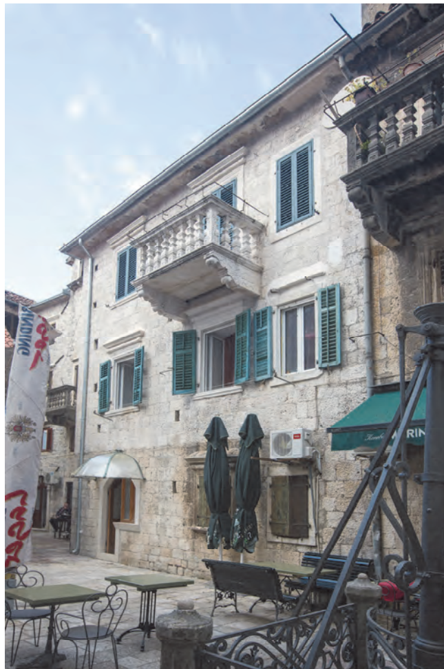
Slika 76. Sadašnji izgled restaurisane jugozapadne strane palate Lombardić

Lombardići se visoko kotiraju u građanskom sloju kotorskog stanovništva tokom XIX vijeka. Kod arhiepizvitera Ilije Lombardića i kapetana i kasnije gradonačelnika Kotora (1877–1884) Toma Lipovca boravili su Petar I i Petar II Petrović Njegoš. Prema predanju Petar II Petrović Njegoš boravio je kod svojih prijatelja Lombardića u sobi na prvom spratu, koja je okrenuta sjeveroistočnim dijelom palati Grgurina, a Gradska muzika Kotor, osnovana maja 1842 godine, samo godinu dana kasnije svirala mu je koncert pod prozorom, na krajnjem sjeveroistočnom krilu palate, koji gleda prema vrtu palate Grgurina. U vlasništvu porodice Stefanović zgrada prelazi 1907, a kasnije je njen sjeverni dio služio za stambene svrhe kotorskih sveštenika, jer je palata sjevernom fasadom neposredno