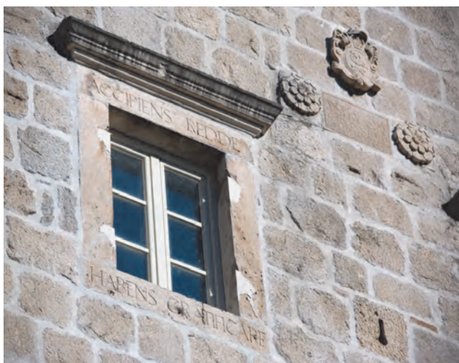
Slika 124. Detalj sa natpisom i grbovima na fasadi palate