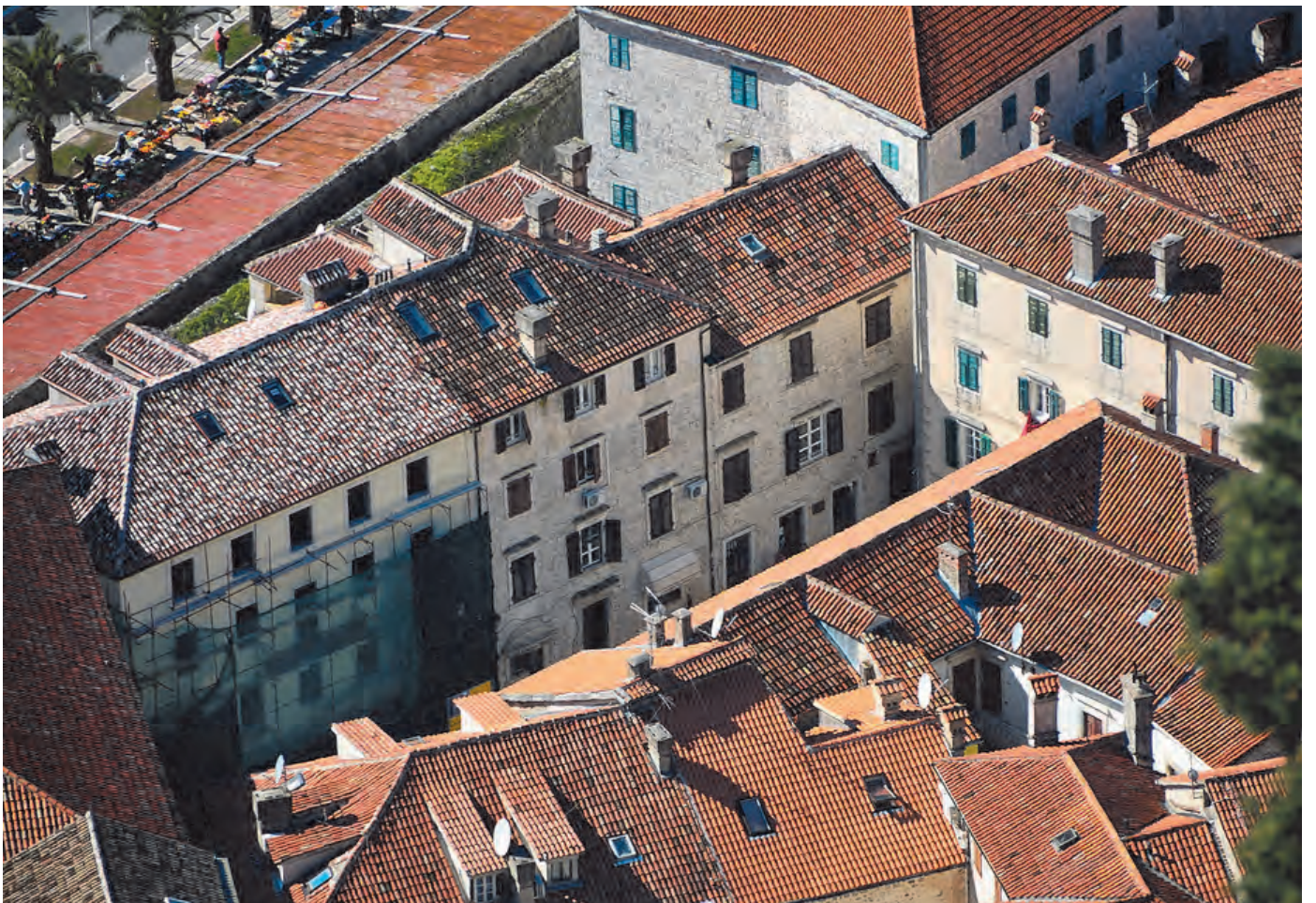
Slika 7. Pogled na palatu Buća