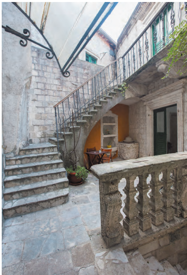
Slika 55. Unutrašnje stepenište palate Jakonja

Nakon zemljotresa iz 1667. ponikla je bukvalno iz pepela još jedna kotorska palata, palata porodice Jakonja, koja se nalazi skrivena od pogleda u ulici koja vodi sa Trga Sv. Tripuna prema Trgu od brašna. Fasada zgrade, okrenuta prema ulici, jednostavno je koncipirana, sa ritmično raspoređenim prozorima i portalima, koji čine simetrične vertikale i horizontale. Na visini prvog sprata nalazi se kameni ispust koji se prostire čitavom dužinom svih fasada palate. Glavni portal je u ravni sa ulicom, sa nadstrešnicom plastične profilacije sastavljenom iz nekoliko stepenastih ispusta nejednake debljine. Sa strana glavnog portala su dva portala renesansne koncepcije, a nad njima je svjetlarnik dvodjelni rasteretni zabat, kao i nad pravougaonim prozorima, što pomalo otvara barokno stremljenje, makar i u sitnim detaljima. Na zapadnom dijelu fasade je jedan magazinski prozor, sa rasteretnim zabatom. Palata ima dva sprata i prizemlje. Na spratovima su prozori barokne profilacije, po četiri u nizu, ravnomjerno raspoređeni. Glavni portal palate u ravni je sa ulicom. Od prolaznog trijema račvaju se dva hodnika koji vode do pomoćnih prostorija. Portal sa desne i lijeve strane ulaznog hodnika barokne su profilacije, srodni portalima u enterijerima ostalih baroknih palata Kotora. Visoko na zidu, rubno, postavljene su kamene konzole, nekada korišćene kao