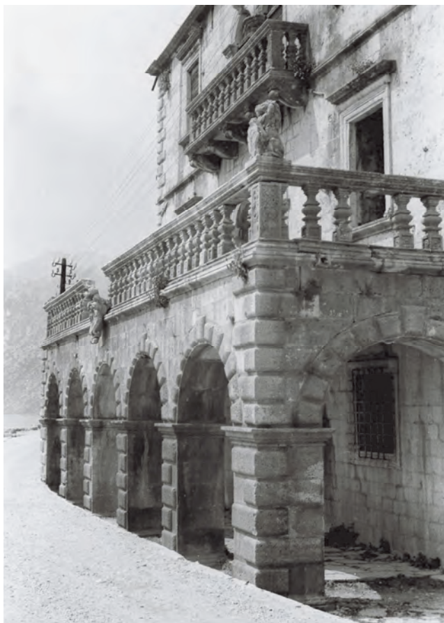
Slika 114. Nekadašnji izgled palate Bujović, sa novoizgrađenim putem

U zapadnom dijelu Perasta blizu mora, od koga ga dijeli samo put, nalazi se palata Bujović, za koju se priča da je nastala od tesanika porušenih hercegnovskih građevina, pošto je Herceg Novi oslobođen od Turaka 1687. godine. Na kamenim pločama na fasadi, njih tri, dati su podaci o godini početka gradnje palate – 1694. Ova građevina, kao jedna od najljepših palata baroknog tipa na Jadranskoj obali, djelo je venecijanskog arhitekta Đovanija Batiste Fontane. Palata je u osnovi koncipirana renesansno, jer u prizemlju počiva na pet lijepo izvedenih arkada u bunjatu sa ispustima koji izlaze upolje po sredini, gdje se spajaju jedna sa drugom. Ovi lukovi podsjećaju na koncepcije donjeg dijela palate Pima u Kotoru, samo što ona ima dva luka većeg raspona.