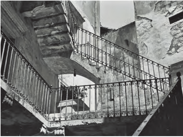
Slika 13. Nekadašnji izgled dvorišta palate Pima