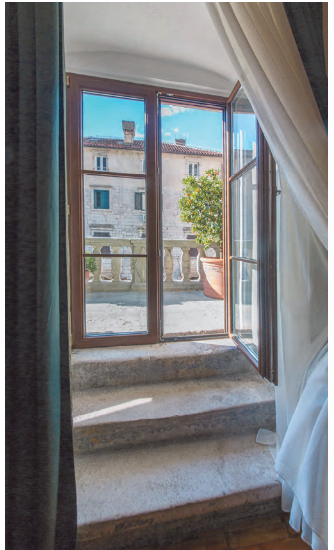
Slika 16. Izlaz na terasu prvog sprata

Prizemni dio palate, sa lijeve strane od glavnog ulaza, danas je prostor Galerije solidarnosti, vlasništvo OJU Muzeji, koja se koristi kao izložbeni prostor. Svojom stamenošću, rasporedom i unutrašnjim sadržajem, koji je uglavnom sačuvao izvorni oblik, sa baroknom profilacijom vrata i prozora i mermernim podom, uglavnom od bijelog kotorskog kamena iz kamenoloma Đurići, ovo je jedna od najljepših kotorskih palata. Ipak, tokom godine, uglavnom na sjenoj strani ulice, podsjeća na zatvorenu, prekrasnu školjku, koja čuteći priča o svom vjekovnom trajanju.