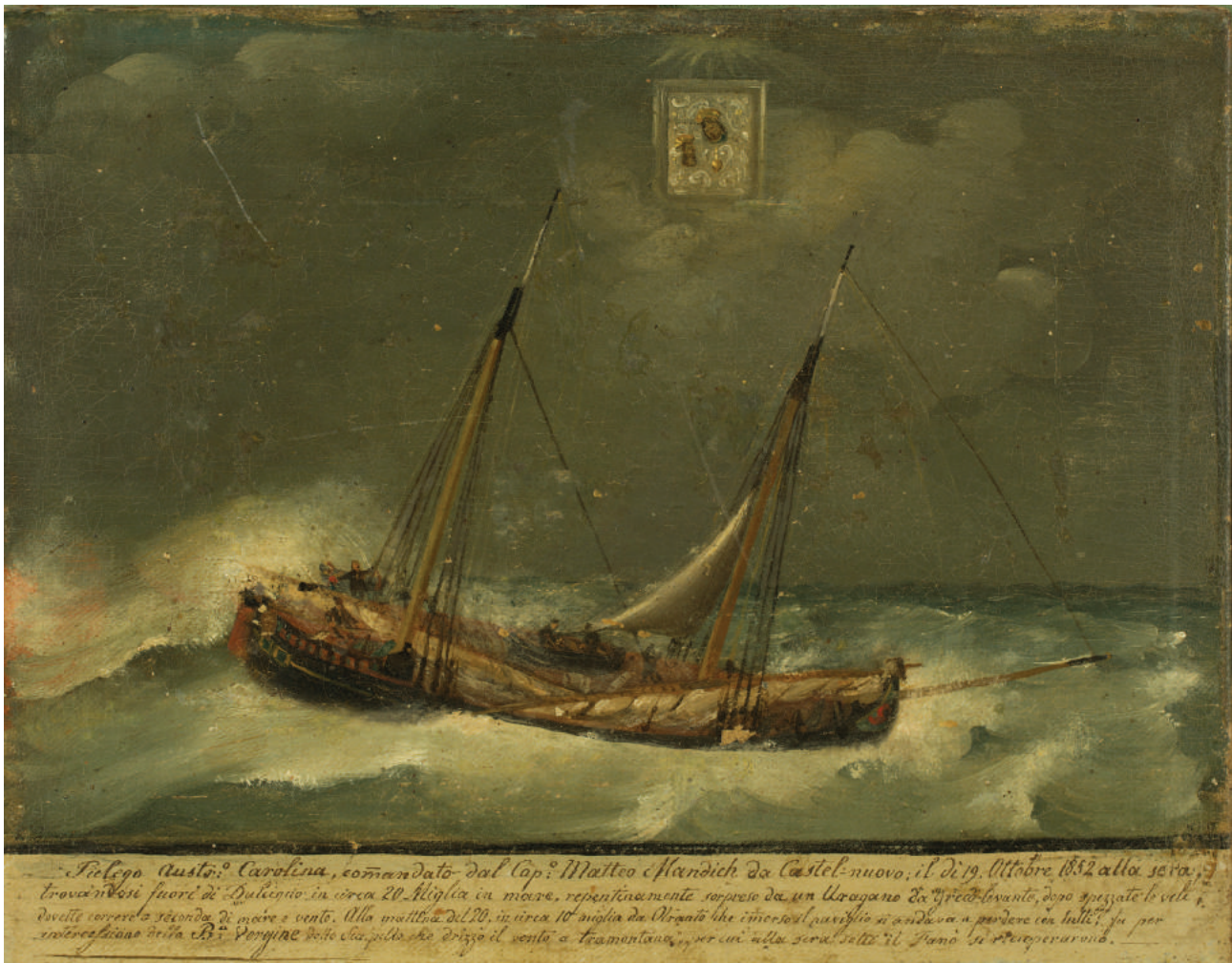
Pjeleg „Karolina“ u oluji Autor: Vicko Poare (Poiret), 1852. godina Ulje na platnu, 31 x 24 cm

Istorijsko-umjetnička zbirka Pomorskog muzeja Crne Gore u Kotoru posjeduje tri slike, akvarela, tršćanskog mariniste Feličea Polija (Felice Polli).