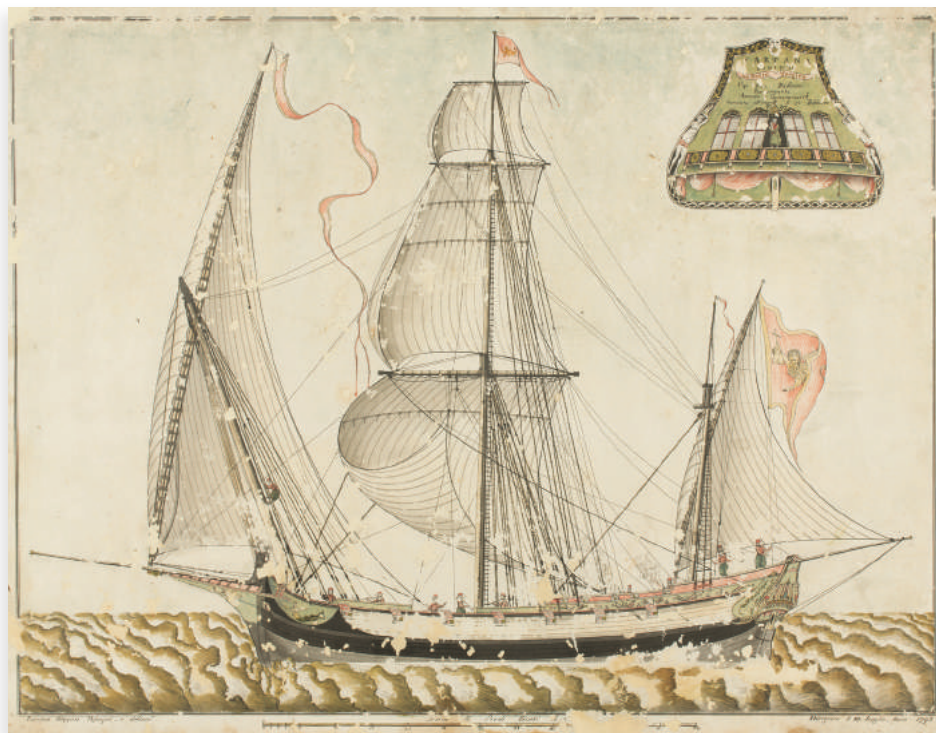
Tartana „La Beata Vergine“

Tartana, najomiljeniji tip jedrenjaka bokeljskih pomoraca, bila je tip broda lake konstrukcije, pokrivena jednom palubom, niskog i tupog oblika. Pramac tartane bio je okrugao, a krma eliptična. Ova vrsta tupog, širokog broda imala je srazmjerno mali gaz, što joj je odgovaralo za plovidbu u lagunama i plitkim vodama. Vrlo pogodna za prevoz tereta različite specifične težine