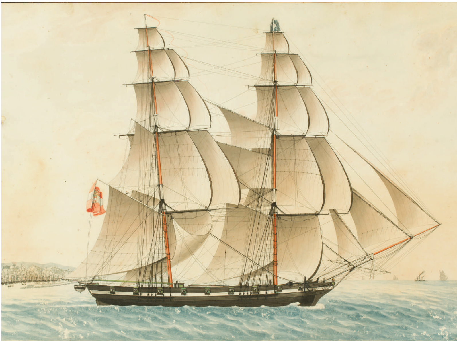
IL CAVALIER MACEDONE.

Brik „Cavalier Macedone“ Autor: Feliče Poli, Trst, 1822 Tehnika: akvarel, 73 x 47 cm