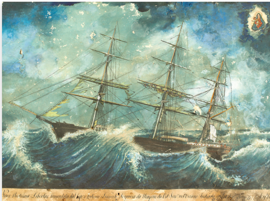
Nava „Libertas u oluji“ Autor: Đovani Luco, 1869/70 Tehnika: gvaš i tuš na papiru, 55 x 36 cm

Nava „Libertas“ prikazana je u strahovitom uraganu, koji je brod, pod zapovjedništvom kapetana Antona Lukovića zahvatio u Indijskom okeanu 17. decembra 1869. godine. Brod plovi po sredini platna u strahovitoj oluji, koja preplavljuje palubu broda između prednjeg i srednjeg jarbola. Ogromni val penje se i do ivice broda u ravni sa trećim jarbolom.