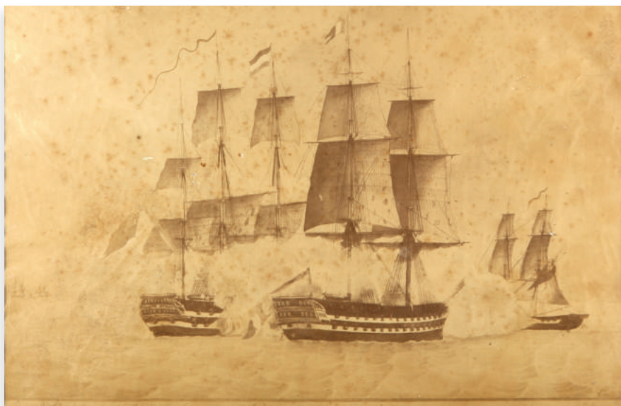
Bitka kod Pirana 1812. godine – predaja francuskog broda „Rivoli“

Naslici sa prikazom predaje francuskog broda „Rivoli“, poslije bitke opisane na prethodnoj slici, grafičko rješenje je kompozicijski slično prethodnoj slici. Dva vašela su okrenuta krmeno, nešto većih dimenzija, sa još jednim manjim jedrenjakom u pozadini. Iako, naokolo, oko brodova kulja gusti dim, smiraj je bitke i trenutak je likovno vrlo autentično ilustrovan. Na poledini grafike Krsto Krile Visković ispisao je tekst koji objašnjava tok i ishod borbe. Grafika još uvijek posjeduje originalni paspartu i crni ram dekorisan pozlatom.