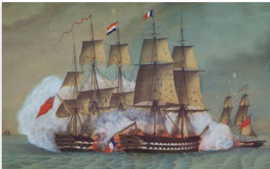
Bitka kod Pirana 1812. godine – predaja francuskog broda „Rivoli“