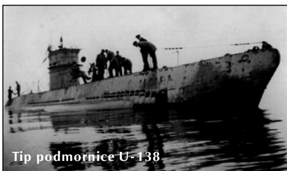
Tip podmornice U-138

Samo nekoliko minuta nakon Boke U-138 je fatalno oštetila britanski putnički brod City of Simla od 10.140 tona, dok je četvrta žrtva podmornice u ovoj akciji bio je britanski teretnjak Empire Adventure od 5.145 BRT, koji je torpedovan i oštećen u ranim jutarnjim časovima 21. septembra.