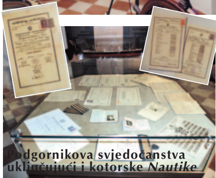
Podgornikova svjedočanstva uključujući i kotorske Nautike