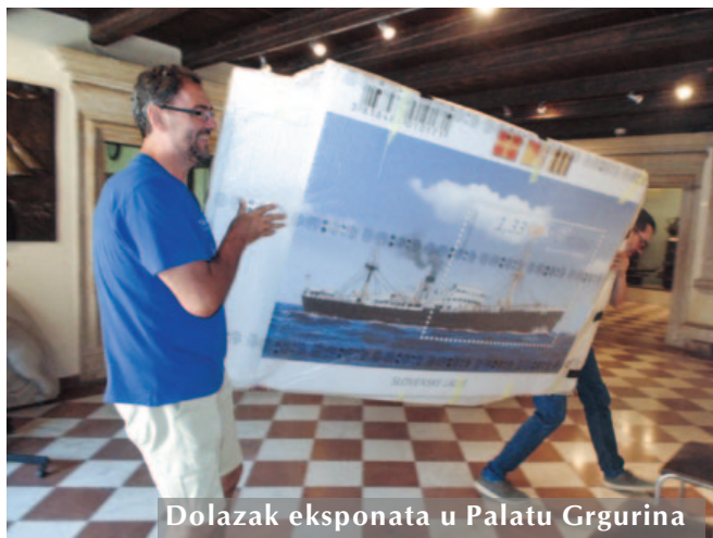
Dolazak eksponata u Palatu Grgurina