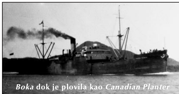
Boka dok je plovila kao Canadian Planter

Uposjed Zetske plovidbe Boka je dospijela 1936. godine kupovinom broda Canadian Planter od mješovite kanadsko-australijsko-novozelandske kompanije MANZ Line iz Montreala. Boka je tada postala najveći brod u floti do rata najveće privatne brodarske kompanija na tlu današnje Crne Gore. Vlasnik