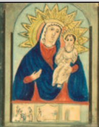
Bark Austriaco Leopoldina Bauer ; gvaš i tuš na papiru, 55 x 35 cm; Đovani Luco, 1869. g.