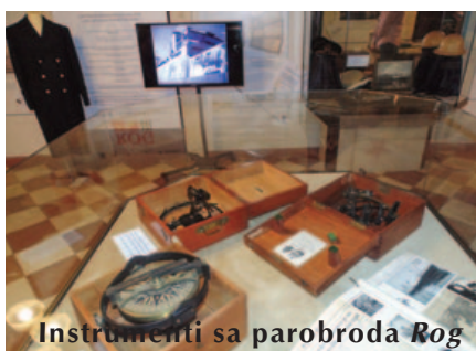
Instrumenti sa parobroda Rog