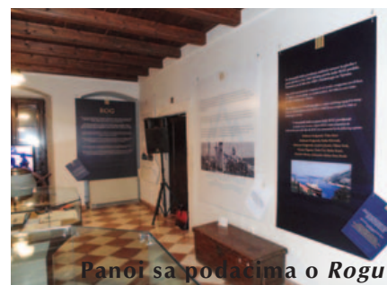
Panoi sa podacima o Rogu