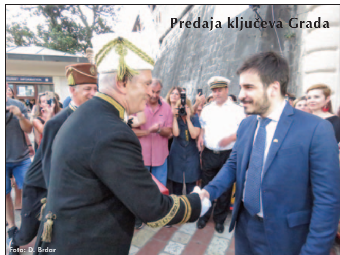
Predaja ključeva Grada