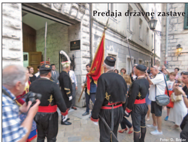
Predaja državne zastave