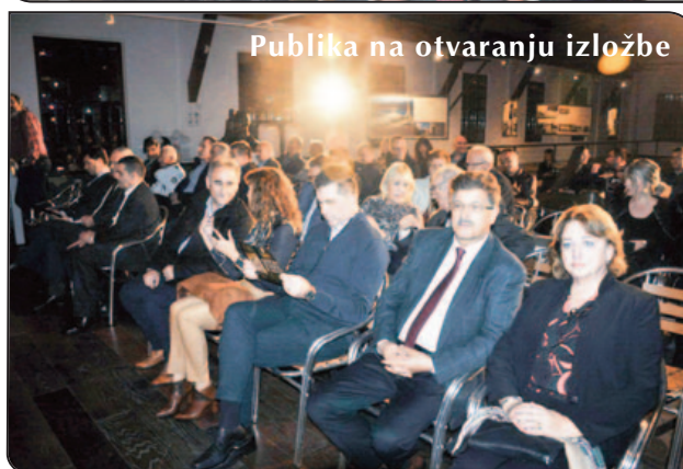
Publika na otvaranju izložbe