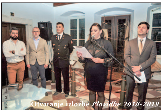
Otvaranje izložbe Plovidbe 2018-2019