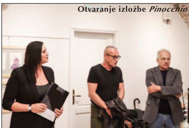
Otvaranje izložbe Pinocchio