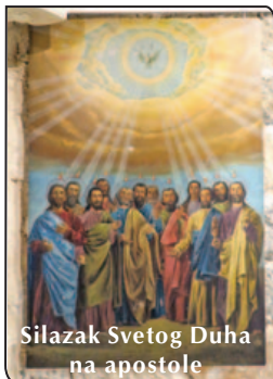
Silazak Svetog Duha na apostole