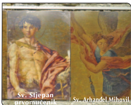
Sv. Stjepan prvomučnik