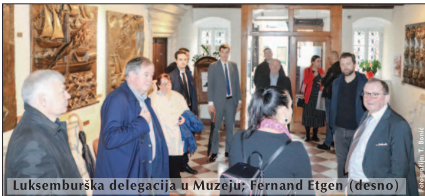
Luksemburška delegacija u Muzeju; Fernand Etgen (desno)

U posjeti Pomorskom muzeju Crne Gore tokom novembra bili su predsjednik Predstavničkog doma Velikog Vojvodstva Luksemburg Fernand Etgen u pratnji članova delegacije te države koja je zvanično boravila u Crnoj Gori, ambasadorica Republike Turske u Crnoj Gori Songul Ozan , te šestočlana ekipa rotarijanaca iz Bugarske.